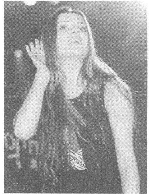
Я не слішу ваших рук