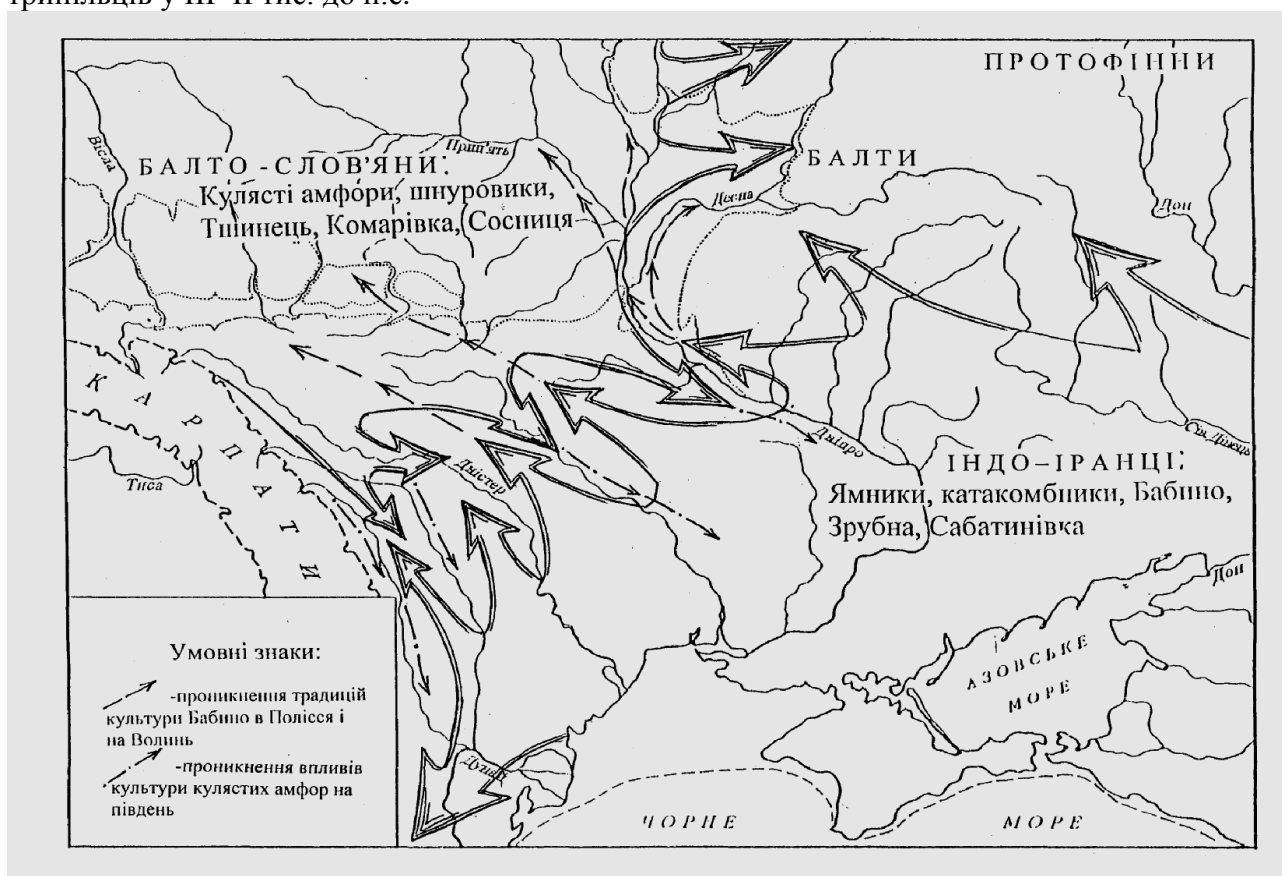
Рис. 24. Розселення пращурів індо-іранців та балто-слов'ян на колишніх землях трипільців у III–II тис. до н.е.