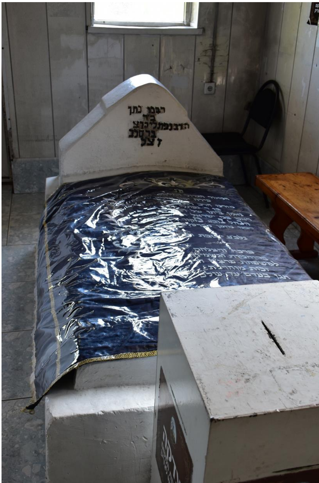
Фото 2023 р. (з матеріалів автора).

Додаток 3. Поховання рабі Натана Штернгарца в Брацлаві. Вид з боку входу.