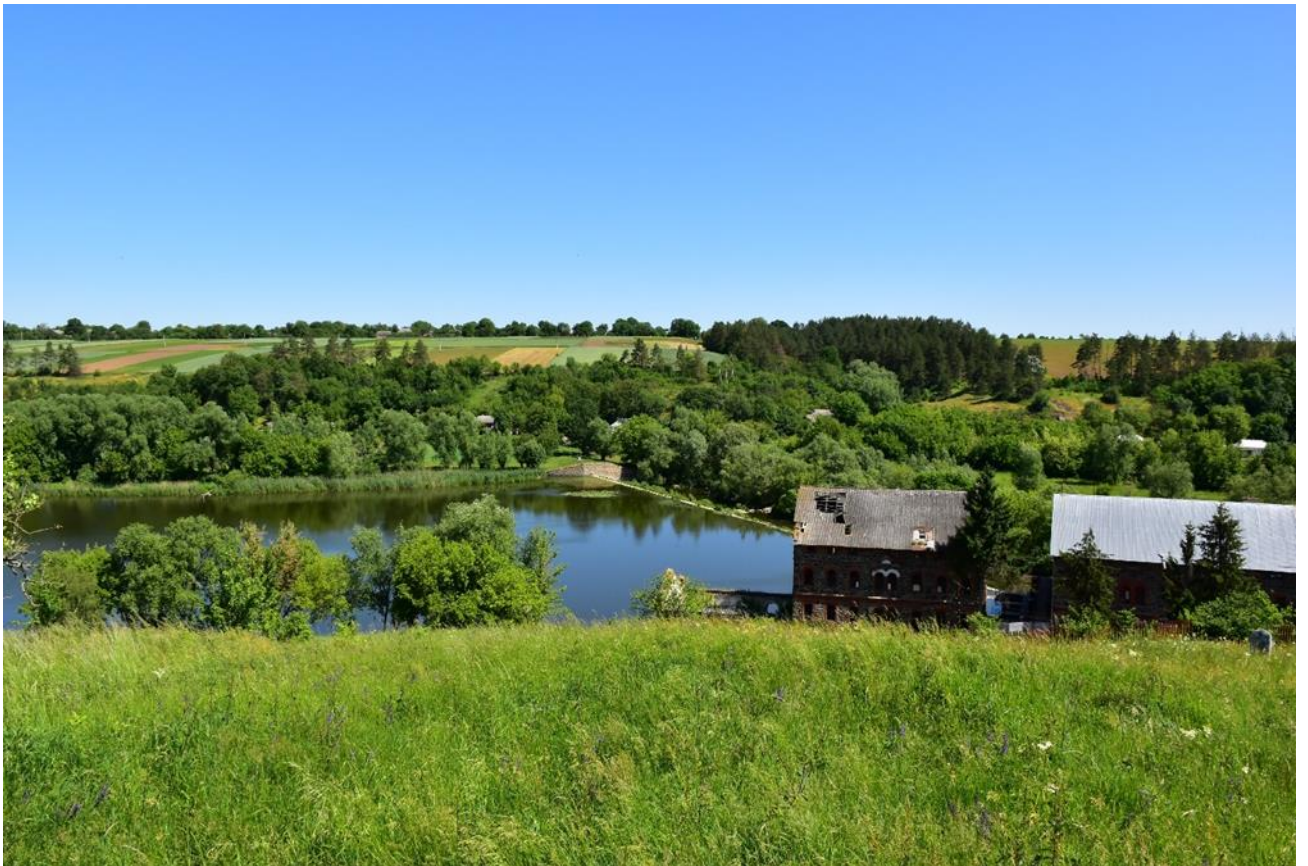
Додаток 2. Вид з єврейського кладовища Брацлава на р. Південний Буг та млин Солітермана. Фото 2023 р. (з матеріалів автора)