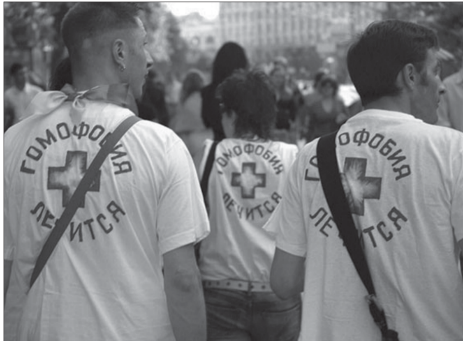
Активісти лесбійей руху роздають на Хрещатику листівки про толерантність (Київ, 2007)

З таблиці видно, що дещо зменшилася частка людей, різною мірою не згодних із тим, що суспільство має ставитися до гомосексуалів як до всіх інших людей (з 34,9% до 28,5%). При цьому не змінилася частка прихильників рівного ставлення (33,7% та 33,3%). Натомість, зросла частка тих, хто дає посередню оцінку – «і згодні, і не згодні» (з 8,9% до 16,3%). Більше ніж п'ята частина населення України взагалі не визначилася у своєму ставленні до гомосексуалів.