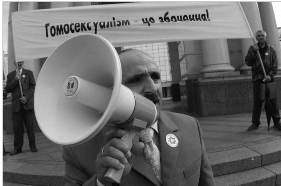
Учасник мітингу «Гомосексуалізм – це збочення» (Київ, 2007)

Із другого боку, гей-активісти відзначають відносну терпимість українського суспільства у ставленні до гомосексуалів порівняно із суспільствами сусідніх країн. На думку керівника гей-форуму України Святослава Шеремета, динаміка розвитку в Україні руху геїв і лесбійок «має позитивну тенденцію», а Київ – «вельми лояльне до геїв місто». До розряду