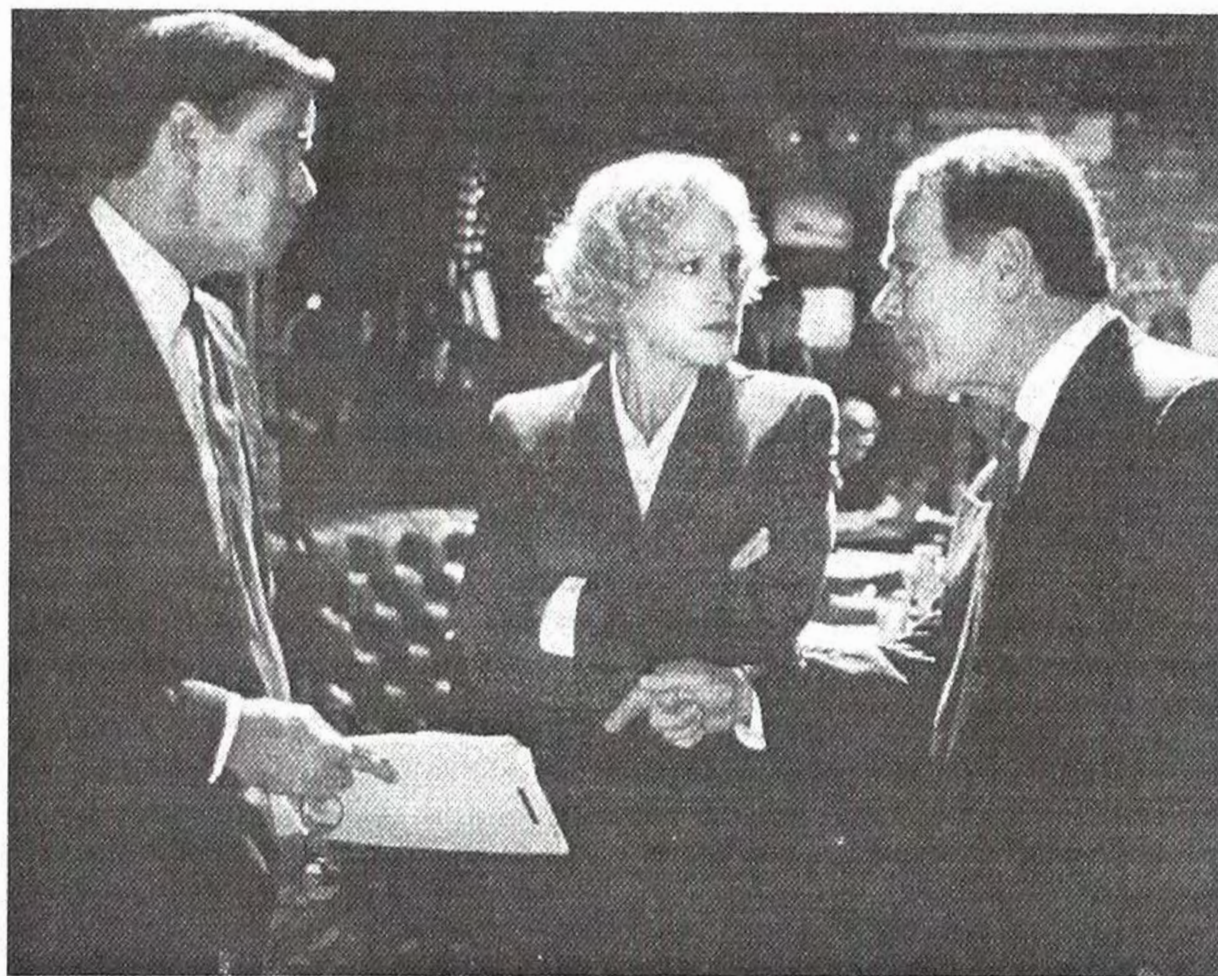
Глен Клоуз у фільмі "Повітряні сили один". Режисер В.Петерсен.

Важко в це повірити, але Глен Клоуз минулого року виповнилось 50! Вона з'явилась на світ 19 березня 1947 року у Грінвіч штату Коннектикут. Її батьки, заможні лікарі, мали змогу забезпечити їй належну освіту в галузі антропології та театро-