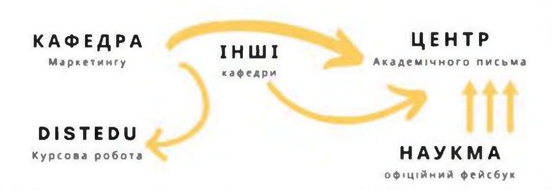
Рис. 3 – Схема взаємодії підрозділів у процесі комунікації питань АД.

Хто? Зважаючи на стратегічне значення теми АД для забезпечення конкурентоспроможності закладів вищої освіти, її комунікація повинна координуватися на загальноуніверситетському рівні. При цьому необхідно забезпечити взаємодію між окремими підрозділами, які мають справу із впровадженням та дотриманням норм АД. Рис. 3 ілюструє схему такої взаємодії за умови існування окремого підрозділу (тут Центр академічного письма), який виступає у ролі ініціатора та координатора комунікації питань АД з різними стейкхолдерами.