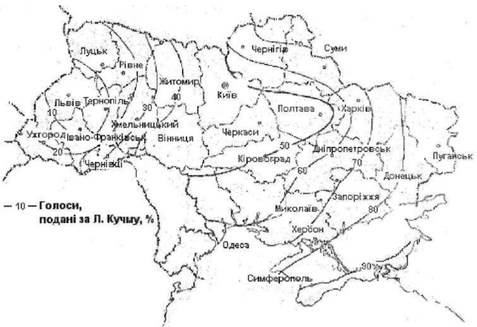
Мал. 2. Вибори Президента України (2 тур, 10.07.1994 р.)

Результати виборів свідчать про істотні територіальні зрушення геополітичної ситуації за минулі після перших виборів Президента два з половиною роки. Національно-державне мислення електорату з західної частини України поступово розширилося майже на все Правобережжя й частково на Лівобережжя (Полтавська обл.). Схід і Південь, піддавшись потужному пропагандистському тиску засобів масової інформації, особливо московського телебачення "Останкино", що сформували імідж "Кравчука-націоналіста", проголосували за Л. Кучму. Програми