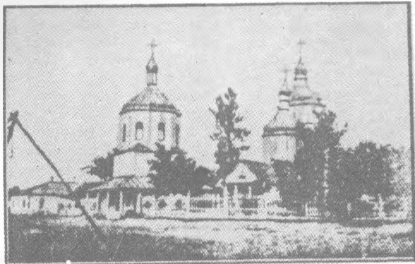
РЕЛІГІЙНО-ЦЕРКОВНИЙ АСПЕКТ ПЕРШОГО УКРАЇНСЬКОГО ВІДРОДЖЕННЯ (XVII СТ.)