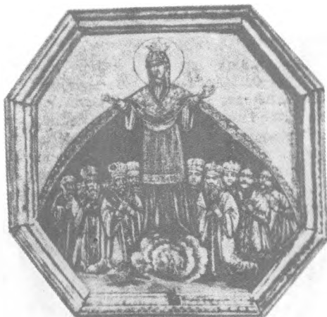
Запорізька ікона Покрови з аналога січової церкви. Дніпропетровський історичний музей.

Тільки з 1632 р., від початку королювання Владислава, який мав репутацію людини толерантної у питаннях віри й до того ж прагнув скористатися з допомоги козацтва у своїх зовнішньополітичних амбіціях, відбувається «заспокоєння» православних, легалізація ієрархії та церковних інституцій. Однак традиції патронату та презентації далися взнаки, і «самовільно» висвячена ієрархія мусила зійти зі сцени. Митрополитом було обрано Печерського архімандрита Петра Могилу (1596—1647 рр.), вже відомого своєю активністю в організації церковних справ, а також прихильністю до нього польської влади. У ці часи козацтво, знесилене збройними конфліктами з владою, послаб-