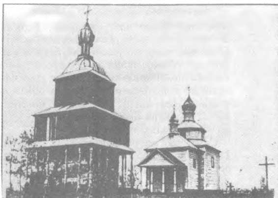
Козацька церква. Переяславщина. XVII ст.