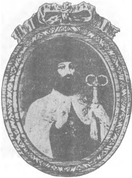
Митрополит Петро Могила (1574—1647).

лює свій вплив на громадське, а разом з тим і на релігійно-церковне життя. Церковні кола вимушені набувати нового досвіду співіснування з державою; вони стають більш лояльними і навіть прихильними до королівської влади — в обмін на її більш толерантну, ніж раніше, політику. Це — так звана «могилянська доба» в історії українського православ'я.