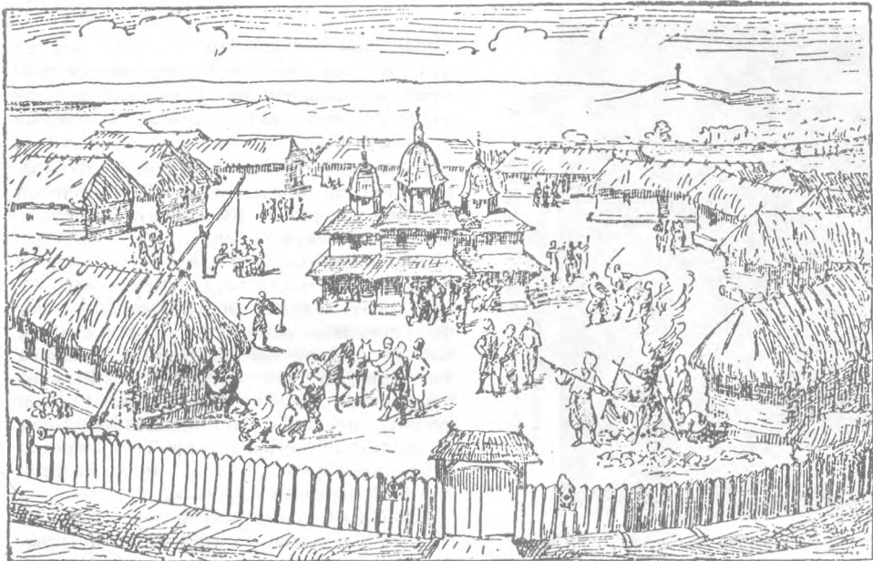
Запорізька Січ (з давнього малюнка).

Успенське братство). Діяльність братств, будучи спробою реформи «знизу», в багатьох випадках позитивно вплинула на внутрішньоцерковне життя, але також і ускладнила його, значно обмеживши єпископську владу (з санкції, до речі, Царгородського патріархату, який надав братствам статусу ставропігій та інших повноважень).