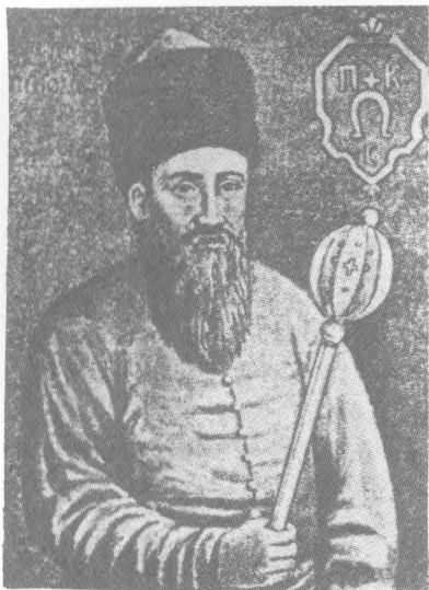
Славний гетьман Петро Сагайдачний, оборонець віри і народу українського.

інтересів православної церкви, православних віруючих в українських землях Речі Посполитої відкрито стає нова суспільна сила — козацтво. Найвідомішим тут є свідок про релігійний конфлікт у Києві, коли козаки на чолі з гетьманом Григорієм Тискиневичем виступили проти Антонія Грековича, намісника уніатського митрополита Іпатія Потія. Тискиневич у листі до київського підвояводи (1610 р.) висловлює рішучість козаків «за церковь нашу восточную і за віру греческую голову... всі положити». Завдяки цьому активізувалося церковне життя — незважаючи на відсутність вищої ієрархії. Так, у 1612—13 рр. у Києві жив софійський митрополит Неофіт, який під охороною козаків виконував єпископські функції серед православних. 1614 р. Єлисей Плетенецький (з 1605 р. архімандрит Києво-Печерської лаври) дістає активну допомогу козаків у справі повернення давніх лаврських маєтків.