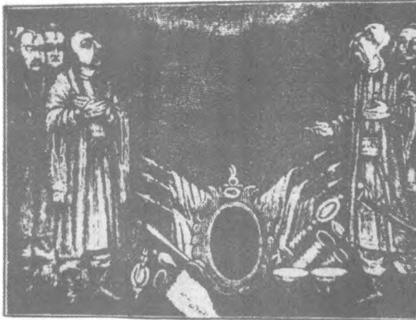
Запорізькі козаки під час молитви. Фрагмент ікони Покрови. Одеський історичний музей.