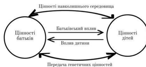
Таблиця 1.2. Шляхи подібності «батько-дитина»

самовдосконалення (влада, досягнення) порівняно із сапоперевершенням (добррозичливість, універсалізм).