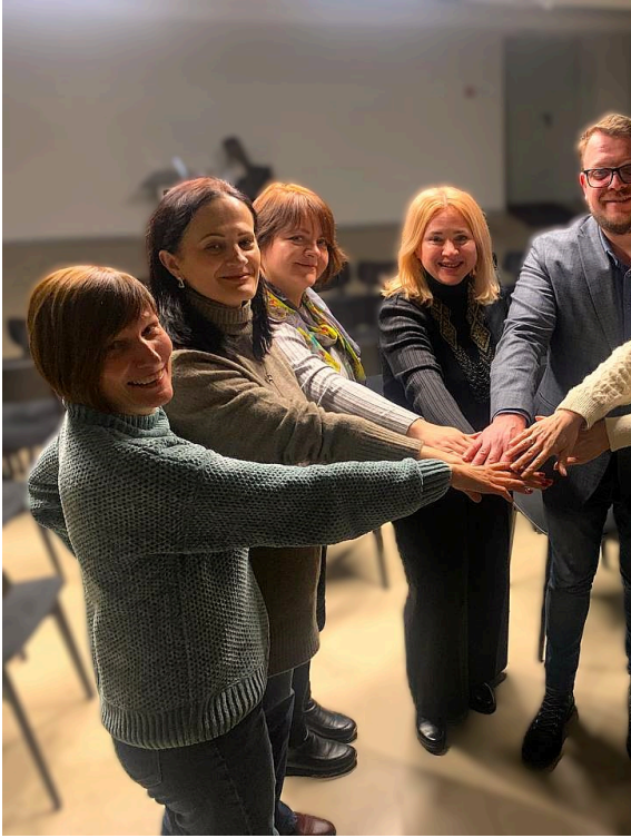
그림 7. 2024~2027년 ULA의 새로운 상

ULA 협회장인 옥사나 브루이(Oksana Brui)는 전쟁이 시작되면, 강조했다. 협회는 국제 미디어 채널을 통해 우크라이나의 상황은 해외에서 열리는 전문 행사의 토론에 참여하기도 했다.(Go