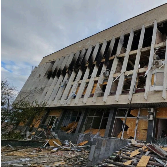
그림 4. 헤르손의 혼차르 지역도서관(출처: Ole

O. 도브젠코 체르니히우 어린이도서관(O. Dovzhenko Chernihiv C (Chernihiv)에서 벌어진 교전 중 발생한 포격으로 피해를 입었는데, 이로 인해 도서관 장서의 일부가 소실되고 기반시설이 후