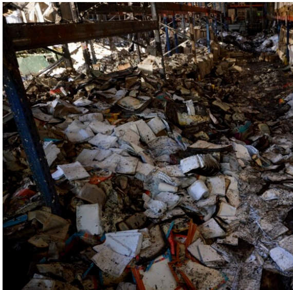
그림 6. 우크라이나 최대 규모 안

2022년 5월, 우크라이나 주재 영국 대사(The British Ambassador) 소위 '비나치화(denazification)' 작전을 구실로 우크라이나 역사를 지웠다.(그림 5 참조)