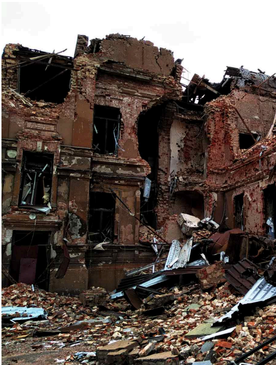
그림 1. 마리우폴의 V. 코롤렌코 중앙시립 공공도

우크라이나 문화전략통신부(Ministry of Culture and Strategic Communication)으로 인해 2025년까지 1,333개의 문화유산과 700개가 넘는으며, 우크라이나어책들과 수천 권의 우크라이나어 출판물이적 기반시설이 무너졌음을 의미하는 것이 아니다.