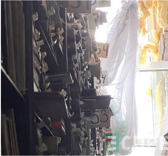
그림 2. 키이우의 막시모비치 과학도서관

2022년 마리우폴 포위전(The siege of Mariupol)으로 인해 V. 코탈(Central City Public Library)이 파괴되었다.(그림 1 참조) 도서관 파괴되었다.(LRHRC «Alternative», 2023)