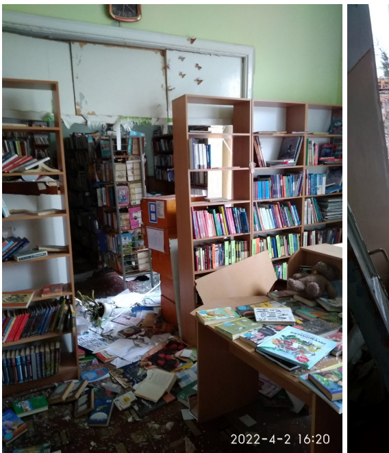
그림 3. O. 도브젠코 체르니히우 어린이도서관

2022년 10월 10일에 발생한 미사일 공격으로 인해 키이우(Kyiv)의 막시모비치 과학도서관(Maksymovych Scientific Library at Taras Shevchenko National University of Kyiv)이 파괴된 대표적인 사례다.(그림 2 참조) 이 공격의 여파로 터르키예, 일본, 한국과 같은 국제 파트너, 우크라이나에 대한 지원을 받았다. 이러한 지원을 통해 붉은색 건물(Red Building, 대 막시모비치 과학도서관)의 창문을 새로 설치하는 등 복구 작업을