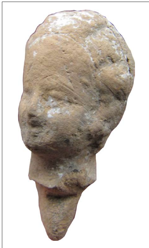
Голова від фігурки танагрського типу. Ольвія, теменос. Колекція № 1656. Розкопки О. І. Леві й О. М. Карасьова 1956 р.