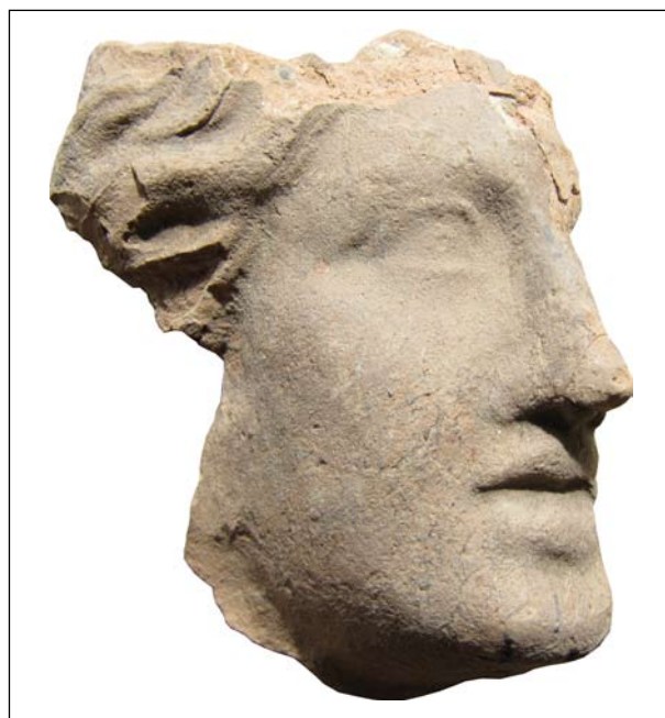
Фрагмент теракоти з жіночим зображенням. Ольвія, теменос. Колекція № 1656. Розкопки О. І. Леві й О. М. Карасьова 1955 р.