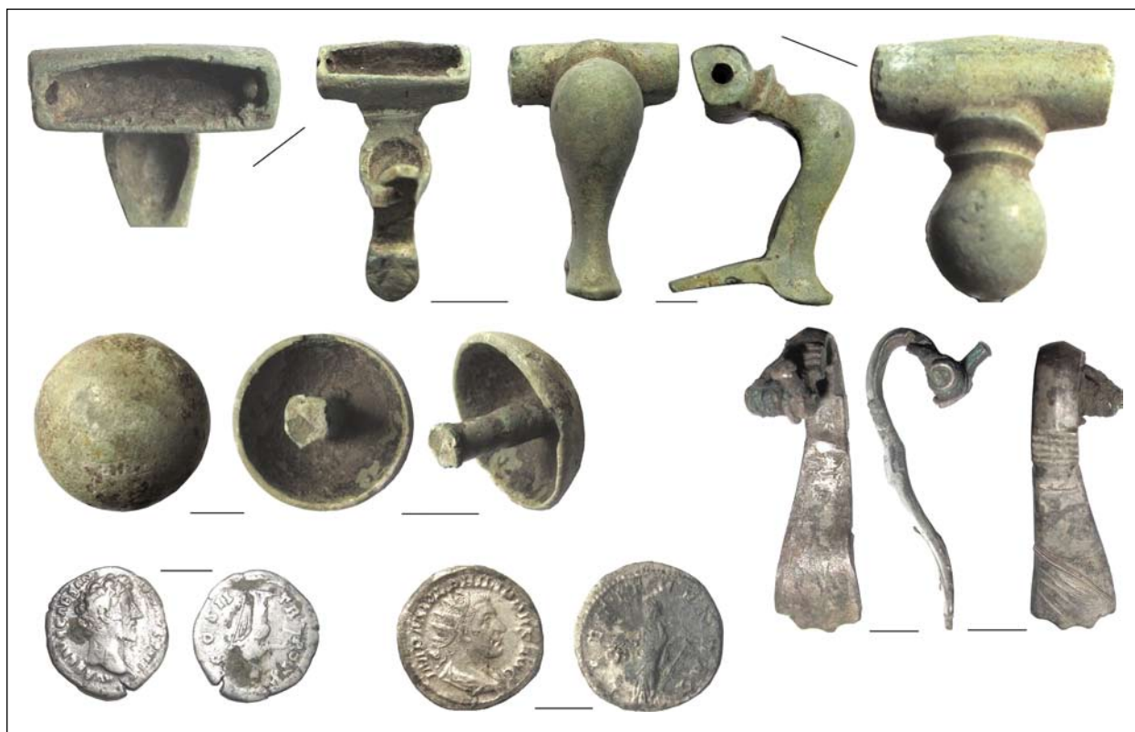
Фібули, кнопка, монети пізньоримського часу. Комарів і Комарів 2. Колекція № 1557, 1583, 1652. Розкопки О. В. Петраускаса 2015—2017 рр.

Склад колекції: гл. — посуд гончарний, ліпний, амфори, пряслиця, плінфа, черепиця; м. ч. — ножі, цвяхи, гостроконечники, пряжка, ключі, стрижні; ск. — намистини, жетон, посуд, джгут; м. к. — фібули, пластини, закінчення ременя, голка, цвях, ніж, скоба; кам. — точильний брусок