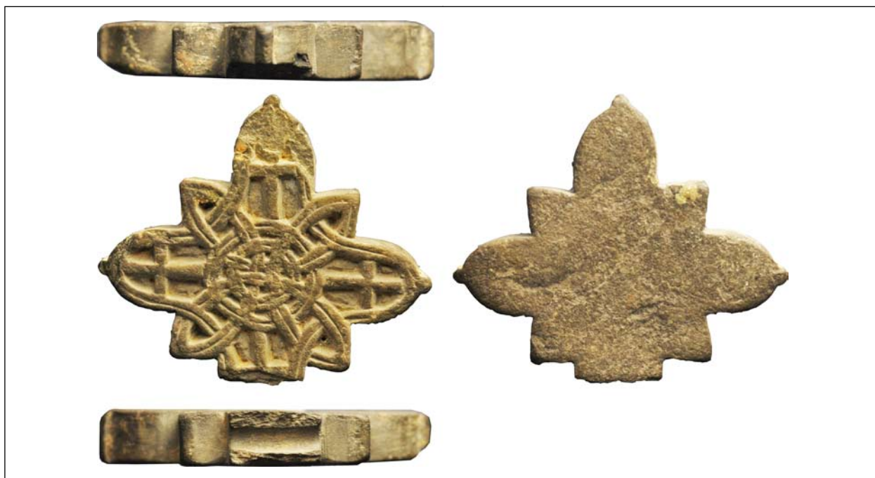
Хрестик кам'яний. Київ, вул. Сагайдачного, 18. Колекція № 1642. Дослідження 1991 р.

Склад колекції: гл. — посуд гончарний, кахлі, іграшки-свищики, люлька, пряслице, плінфа, цегла; м. ч. — голка, підкова, ножі, цвяхи, пряжка, вістря стріл; кам. — точильні бруски, розтиральник, кремій (відщепи, пластини, луска); м. к. — пряжка, гудзики, хрестик; ск. — посуд, браслети.