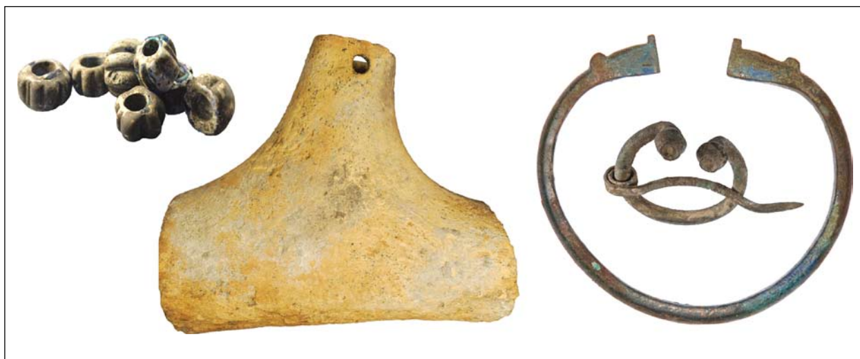
Намистини, браслет, фібула, кістяний контейнер. Острів, могильник XI ст. Колекція № 1643, 1653. Розкопки В. Г. Івакіна 2017—2018 р.

Склад колекції: гл. — посуд гончарний, ліпний, амфори, обмазка, пряслиця, грузок; м. ч. — дужка відра, шпора, ножі, спис, гачок, кільця, дріт, пряжки, цвяхи, вістря стріл; м. к. — кільця, пряжки, важок, фібули, монети, браслет, гудзики, фібули, пряжки, застібки; кам. — бруски точильні, пряслице пірофіліто-