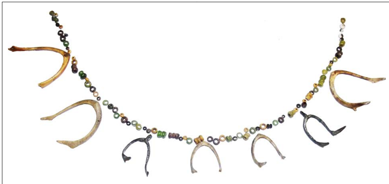
Намисто і вилючкові кістки качок та гусей і їхні металеві імітації з об'єкту XII ст. Софіївська Борщагівка. Колекція № 1638. Розкопки І. А. Готуна 2017 р.

с. 92-94; Казимір, О., Готун, І., Шахрай, Д., Сينيця, Є., Бабенко, Р., Гунь, М., Лозниця, Т. 2019. Продовження розкопок південної частини поселення Софіївська Борщагівка. Археологічні дослідження в Україні 2017 , с. 95-97.