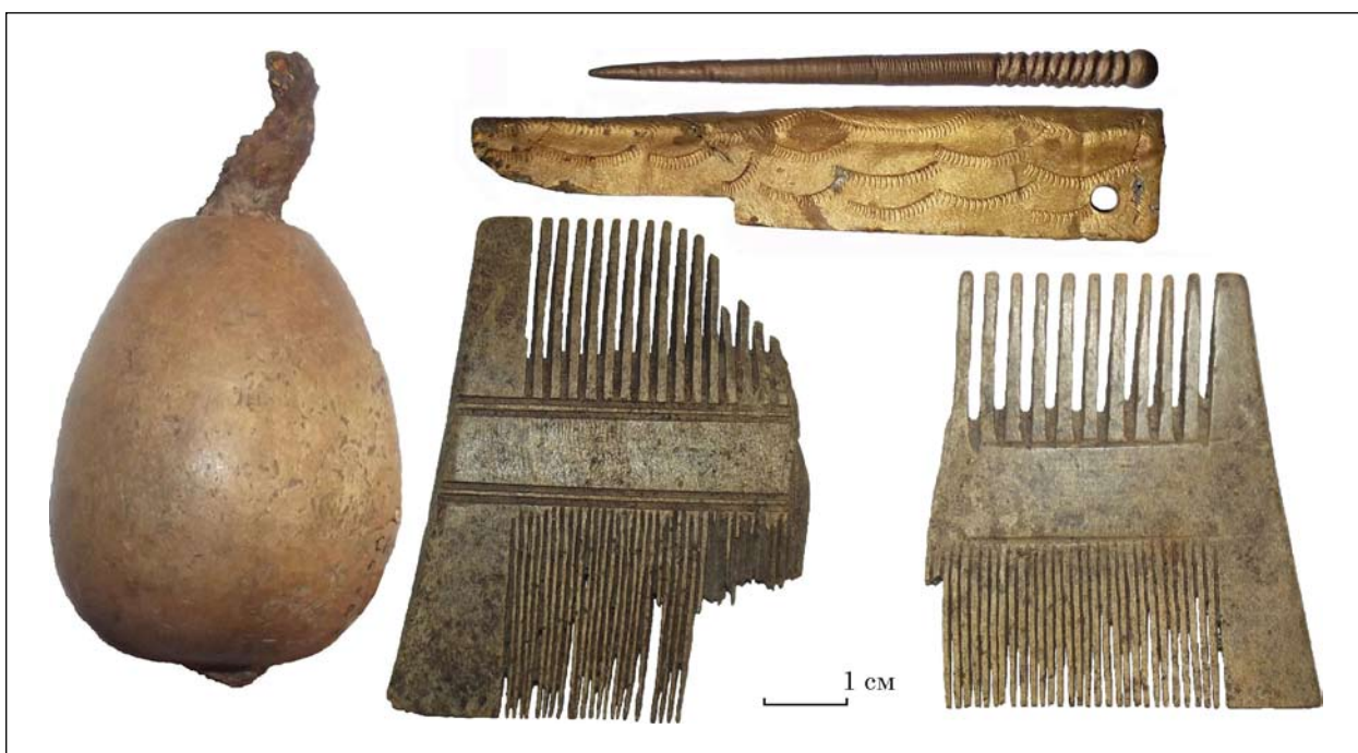
Кістяні гребені, кістень, підвіска з писалом кольорового металу. Софіївська Борщагівка. Колекція № 1637. Розкопки І. А. Готуна 2014 р.

Література: Казимір, О. М., Готун, І. А., Осипенко, М. С., Синиця, Є. В., Непомящих, В. Ю., Шахрай, Д. О., Гунь, М. О., Лозниця, Т. В. 2015. Продовження досліджень розкопу III на селищі в Софіївській Борщагівці. Археологічні дослідження в Україні 2014 , с. 87-90.