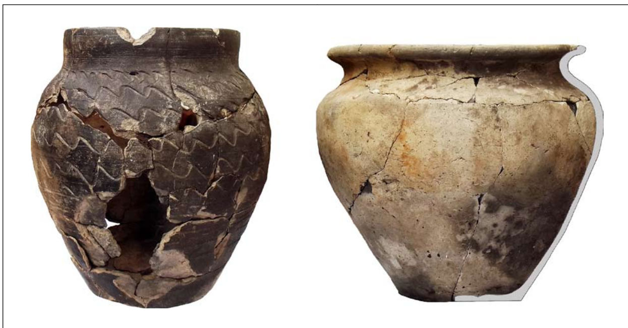
Гончарні горщики. Софіївська Борщагівка. Колекція № 1637. Розкопки І. А. Готуна 2014 р.