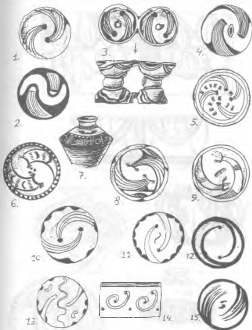
Мал. 2. Вихроподібні зображення на пізньотрипільських мисах та посудинах (змій-дощ, змій-веселка).