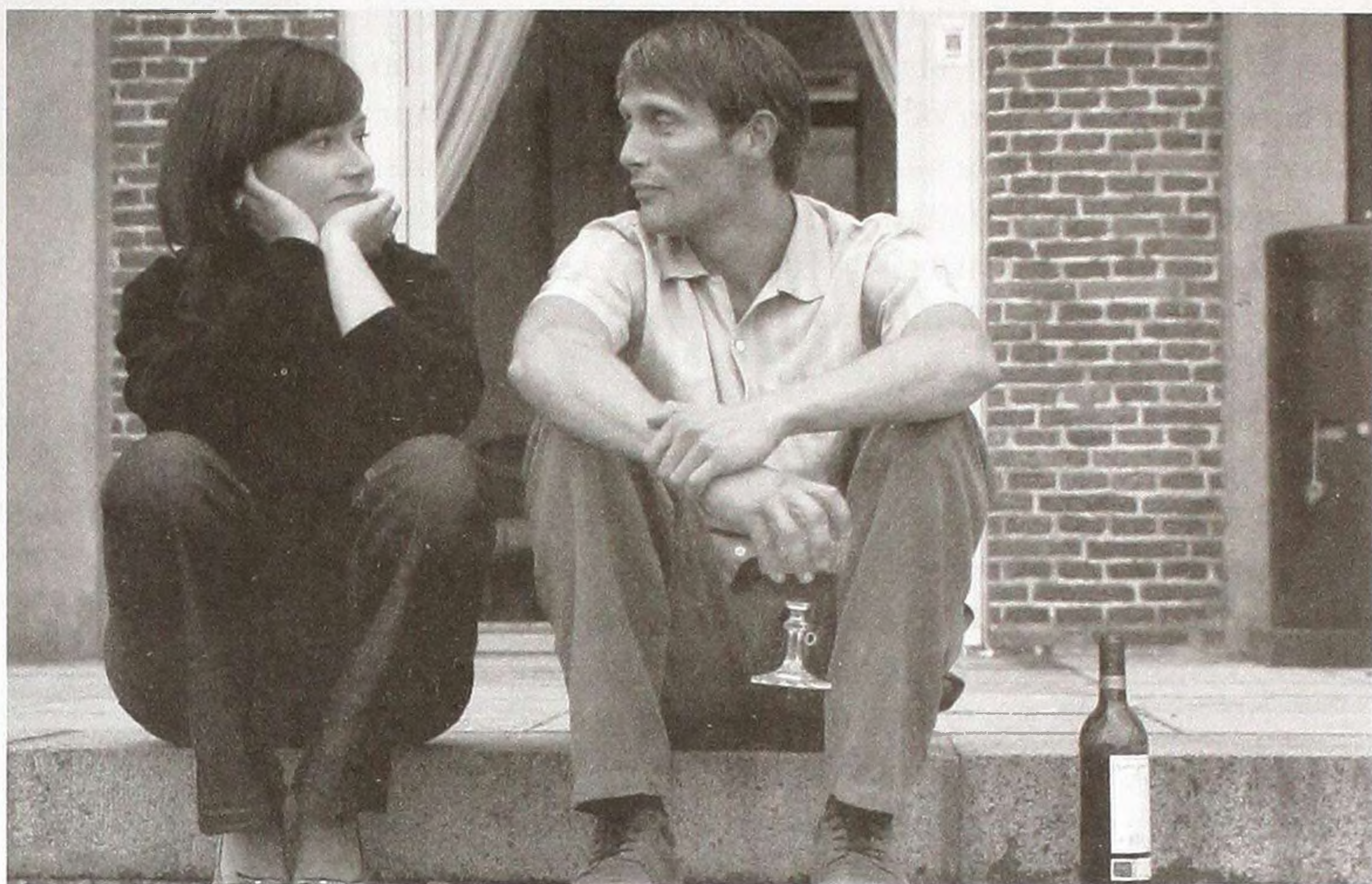
Мадс Міккельсен і Сідсе Бадетт Кнудсен у фільмі «Після весілля». Режисер Сюзанна Бір. Данія, 2006

Мадс Діттман Міккельсен (22.11.1965) – данський кіноактор. Володар нагород Європейської кіноакадемії (2006) та Каннського МКФ (2012) за найкращі чоловічі ролі. 2010 року отримав від королеви Данії титул лицаря і був нагороджений данським Орденом Данеборга, другим за значимістю лицарським орденом країни. В доробку 49-літнього актора – понад сорок кіно- і телеролей.