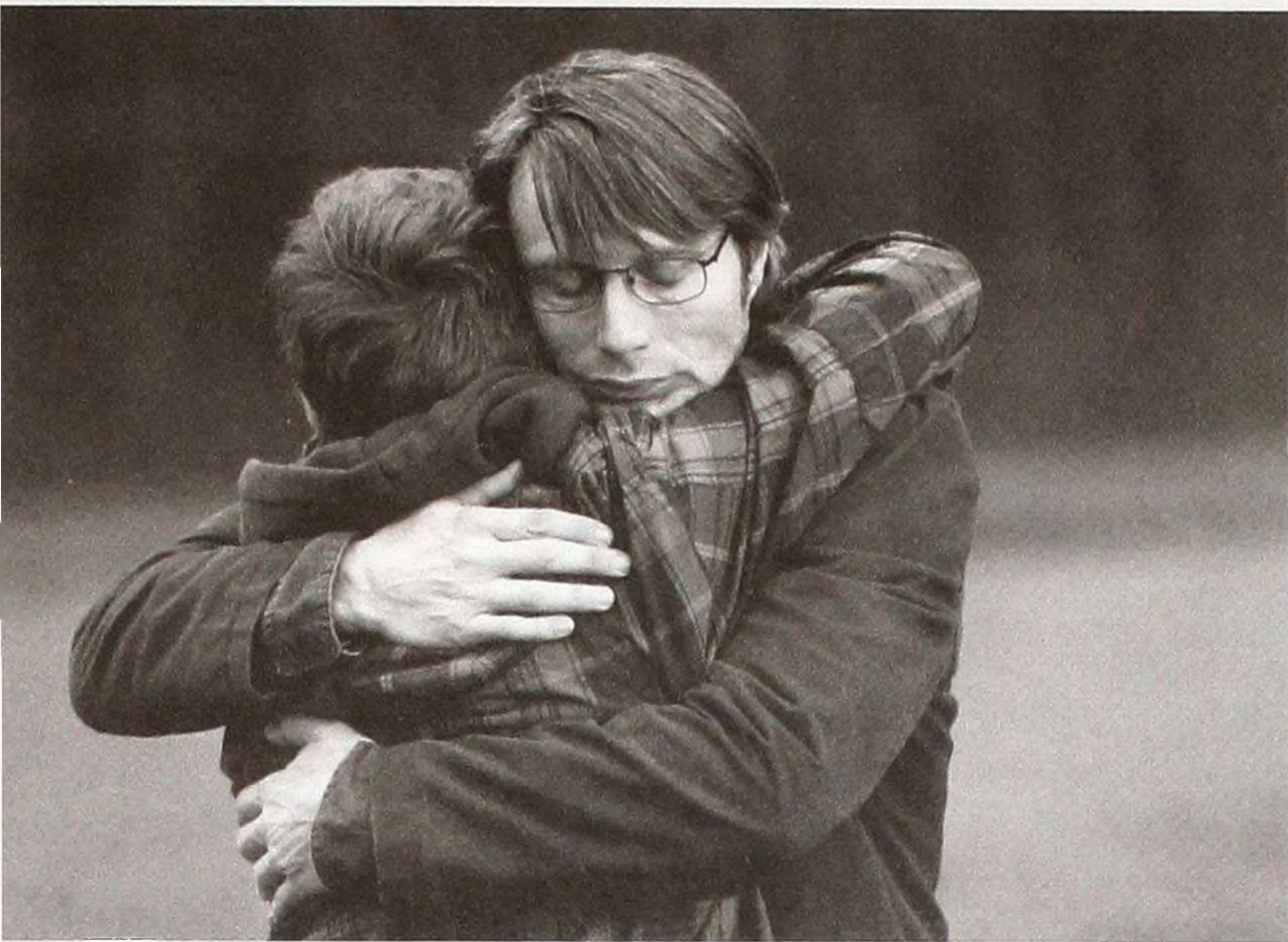
Мадс Міккельсен у фільмі «Полювання». Режисер Томас Вінтерберг. Данія, 2012

то великих планів (передусім людських облич) і позбавлений зайвих «красивостей» монтаж.