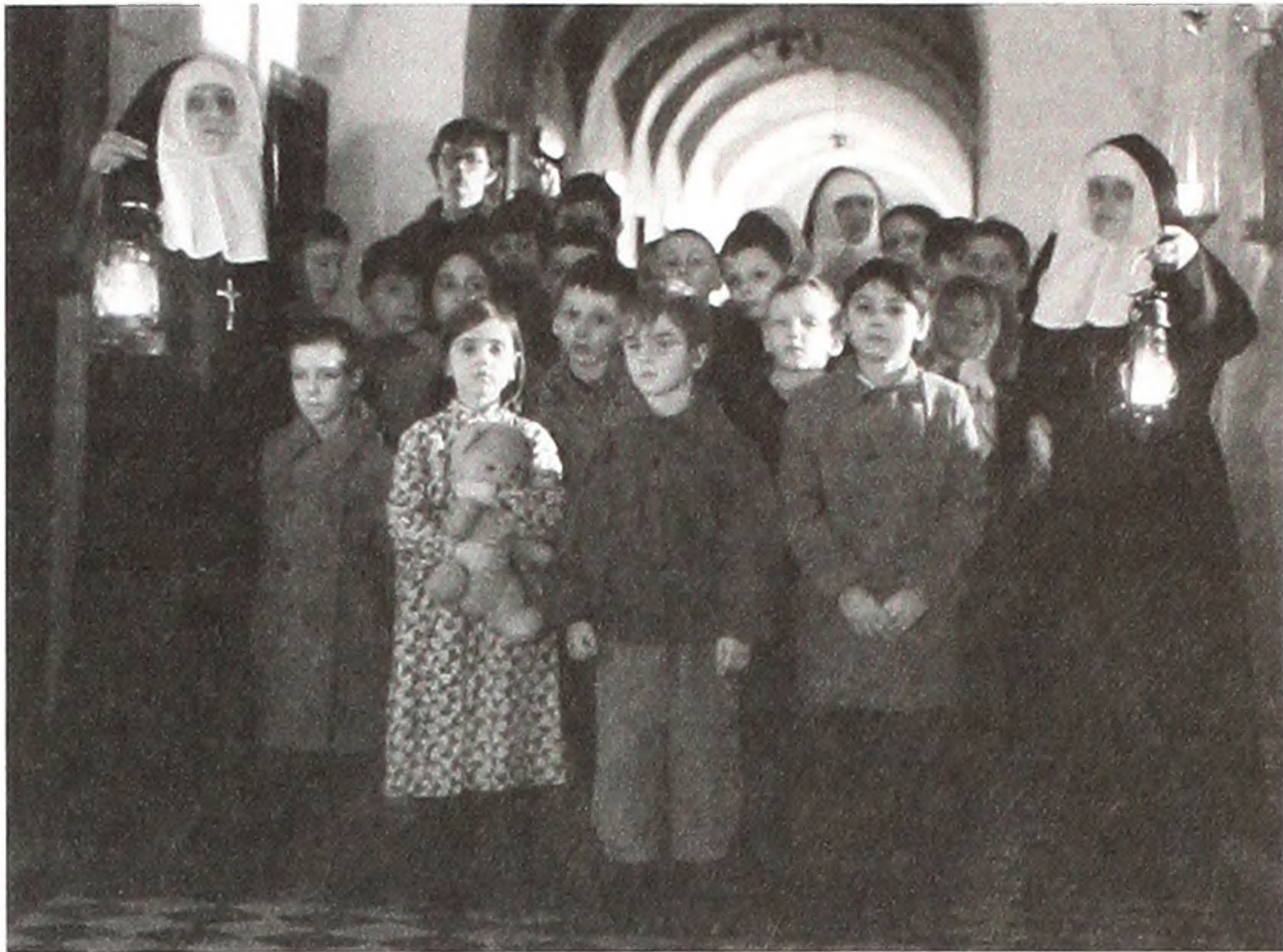
Кадр з фільму «Владика Андрей».