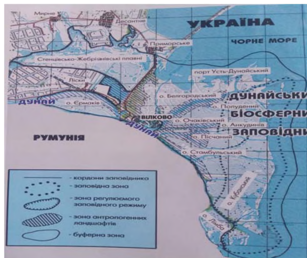
Рис. 2. Система функціонального зонування Дунайського біосферного заповідника, Україна [14]