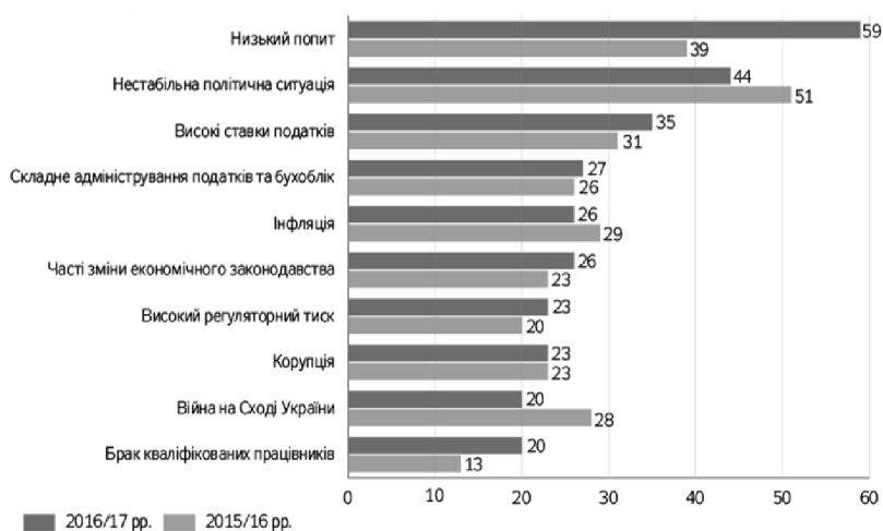
Рис. 1. Рейтинг перешкод розвитку бізнесу

Створюючи позитивний ефект для національної економіки, МСП у свою чергу зазнають опосередкованого впливу зовнішніх умов в державі. Всі екстерналії впливу на МСП можна розділити на дві основні категорії – зовнішні та внутрішні.