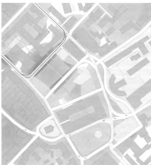
Мал. 1. «Емоційна» карта Контрактової площі. Червоним забарвлені зони площі, які викликають переважно негативні відчуття у її щоденних користувачів; зеленим — переважно позитивні. Інтенсивність кольору відображує рівень упізнаваності окремих будівель

Картографування Контрактової площі дозволило визначити найбільш упізнавані (а отже, найбільш значимі) для громади об'єкти, а також з'ясувати, як сприймаються