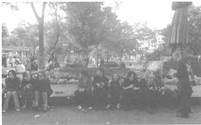
Мал. 2. Неформальна молодь поблизу пам'ятника Сковороді, їхнього улюбленого місця зустрічей на Контрактовій площі (фото 2010 р.)

2) Швидко промайнувши кіоски і трамвайні колії, пішохід потрапляє в найбільш жваве і впізнаване місце Контрактової, популярне саме як місце зустрічей, спілкування і публічної активності, — сквер із пам'ятником Сковороді. Тут завжди багатолюдно і голосно: