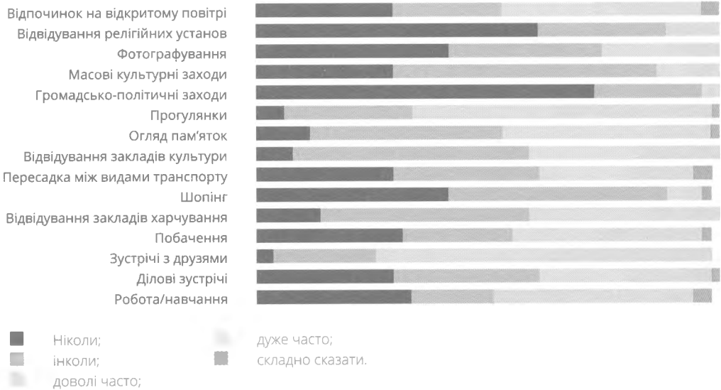
Діаграма 2. Для чого, в основному, використовується громадянами й громадянками Контрактова площа.