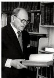
Омелян Пріцак: біографічні дані