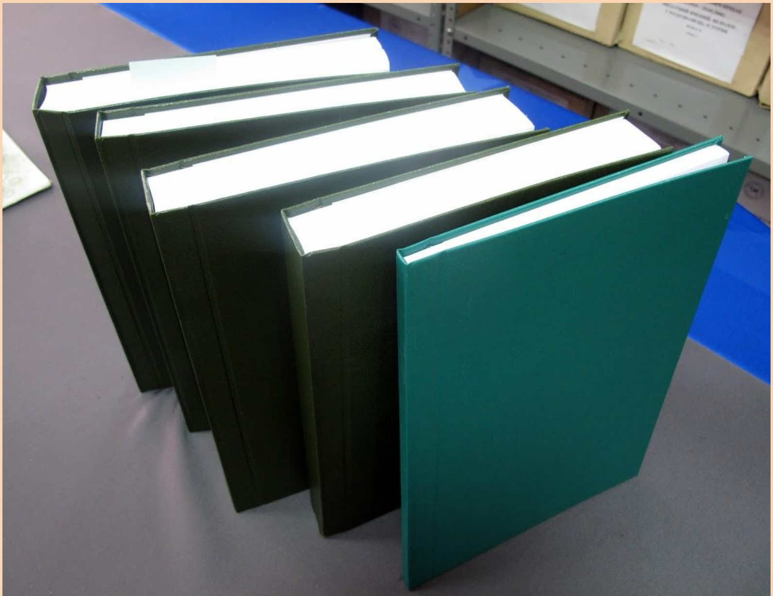
4 описи архівного фонду видатного вченого ХХ ст. Омеляна Пріцака, що зберігаються в Науковій бібліотеці НаУКМА