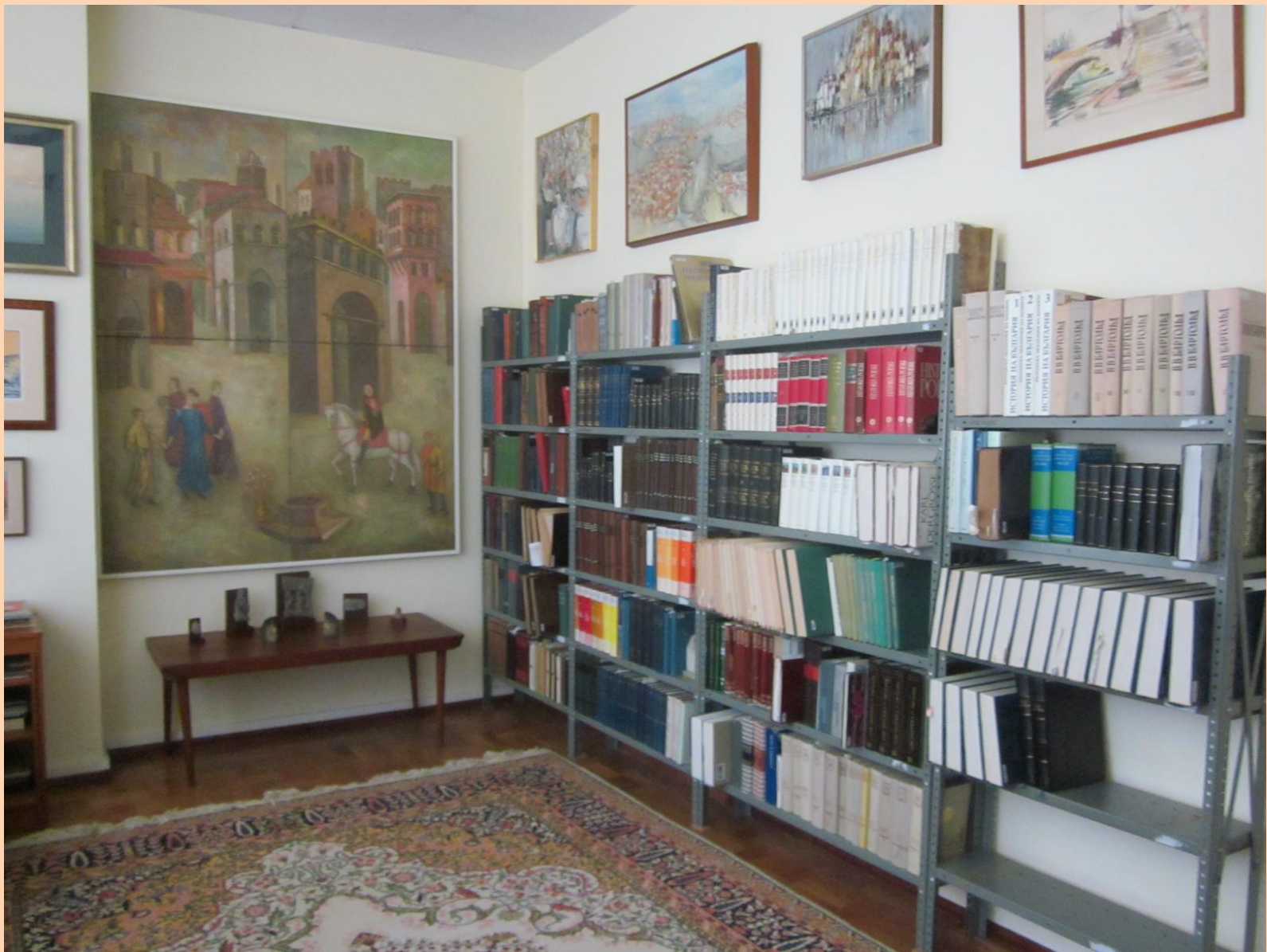
Меморіальна бібліотека Омеляна Пріцака в Національному університеті «Києво-Могилянська академія»