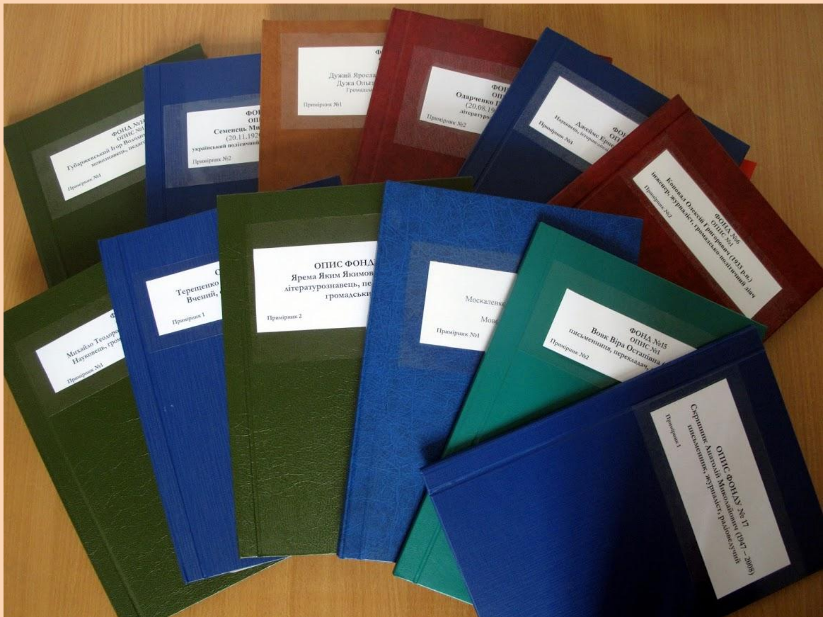
Описи архівних фондів, що зберігаються в Науковій бібліотеці НаУКМА