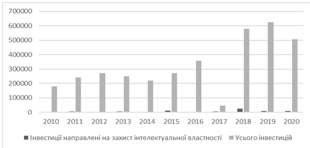
Рис. 3. Частка інвестицій направлених на захист ІВ у відношенні до загального обсягу інвестицій в Україні.

По-третє, в Україні ще молода та нерозвинута система охорони прав ІВ (див. рис. 3). Хоча необхідна правова база по ІВ існує, але вона має ще багато недоліків, які потребують удосконалення. Окрім цього значною причиною повільного розвитку інтелектуального інвестування є зношення, як моральне, так і фізичне, більшості основних фондів наукових організацій і установ. І також можна спостерігати низький рівень зацікавленості науковців роботою в національному секторі.