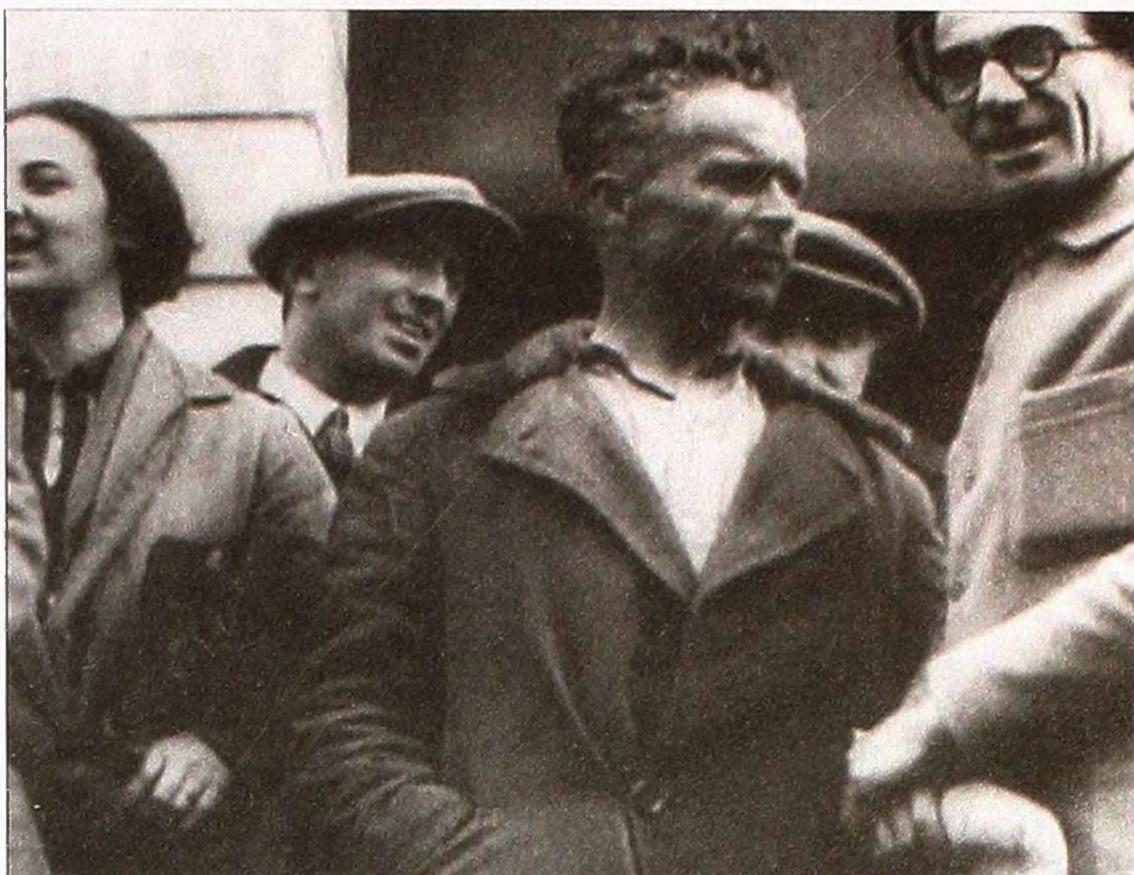
Олександр Довженко під час роботи над фільмом «Арсенал». Документальне фото, використане у фільмі «Довженко в огні».

У тканину стрічки вплетено й фрагменти з «Камінного хреста» Леоніда Осика, численні знімки Коломиї, Львова, Відня кінця ХІХ й початку ХХ століття. І, звичайно ж, рідного письменникового села Русова, де нині діє меморіальна хата-музей Василя Стефаника.