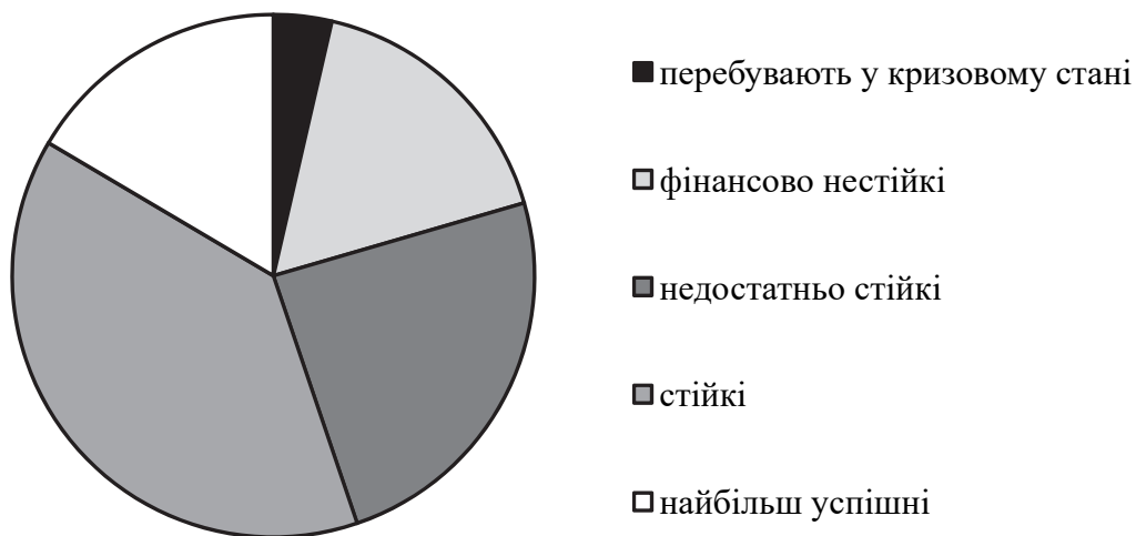
Рис. 2. Структура досліджуваних сільськогосподарських підприємств за характеристикою фінансово-економічного стану, %