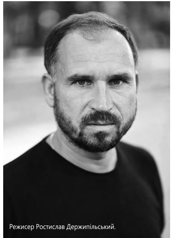
Режисер Ростислав Держипільський.