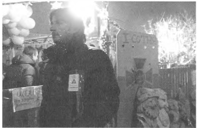
Кадр з фільму «Перша сотня». Режисери Ярослав Пілунський, Юрій Грузінов, Юлія Шашкова. Україна, 2018.

був військовий штаб. Коли на сцені Майдану лунали пісні, тут обдумували «військові операції», стратегію спротиву, виховували недисциплінованих. І в тоні, яким вичитують порушників, відчувається воля військових людей, і виховання сприймається як цілком зрозуміле, бо дисципліна є запорукою перемоги. Але планування «військових операцій» не фіксувалось (та й чого б розкривати їх перед камерою?). До речі, якщо говорити про стосунки між персонажами стрічки, які спочатку ще не сприймаються індивідуалізовано, і кінооператорами, то відчувається взаємна згода-довіра, без чого такий правдивий фільм був би неможливий. Враження таке, що кінематографісти були не просто спостерігачами, а частиною цієї «бойової одиниці», і це враження посилюється в одному з ключових епізодів. Маю на увазі ризиковану і зухвалу вилазку майданівців на територію противника, тобто на урядовий квартал, що його щільним кільцем охороняв «Беркут». Камера простує за сміливцями, які проникають у заборонене місце через парк, і фіксує, як на освітленій вулиці лупцюють беркутівця, як захоплюють щити, як по команді відходять.