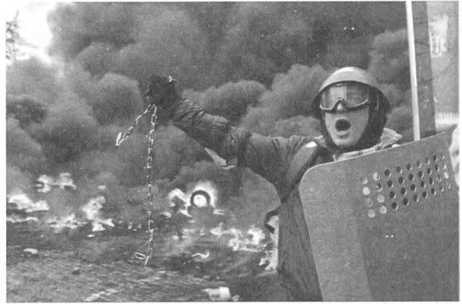
Кадр з фільму «Перша сотня».

Між Майданом і Донбасом – стислий епізод у тренувальному таборі «Десна», де в порожніх приміщеннях новоспечені бійці різного віку розставляють залізні ліжка (порівняно з Майданом, це вже цивілізовані умови). Там же складають військову присягу. А потім – фронт. Бункер.