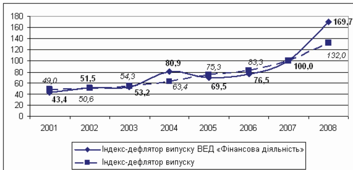
Рис. 1. Індекси-дефлятори випуску за 2001–2008 роки у постійних цінах 2007 року (%; 2007=100)