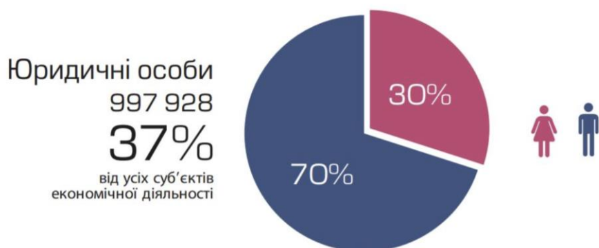
Рис. 1.2. Частка жінок серед керівників юридичних осіб