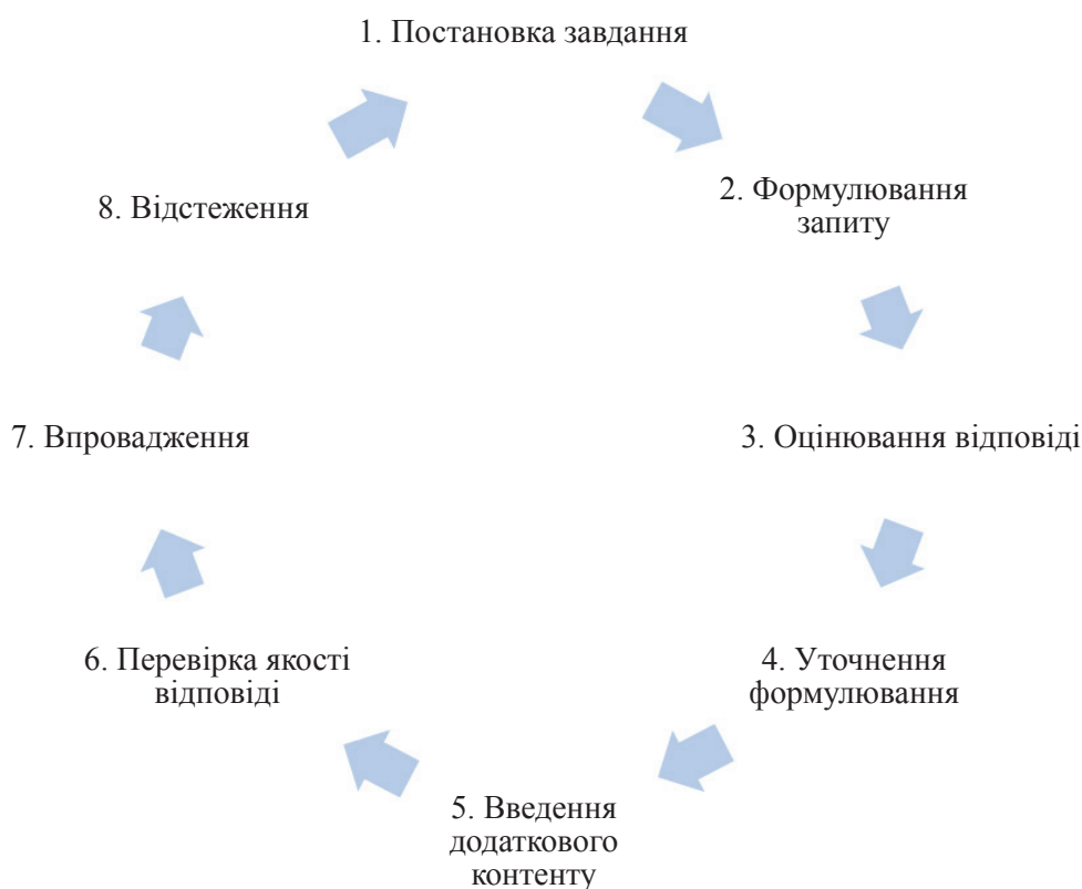
Рис. 3. Життєвий цикл промпту

Важливо пам'ятати, що гнучкість і адаптація промпту до конкретного завдання часто мають ключове значення для отримання найкращих результатів 18 . У процесі оптимізації бізнес-процесів потрібно брати до уваги специфіку галузі, ринку, кожної окремої компанії. У цьому може допомогти використання певних типів запитів, узагальнених у таблиці (див. нижче).