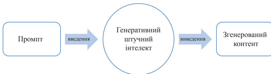
Рис. 1. Загальна схема формування промпту (запиту)

Джерело: склали авторки на основі опрацьованих матеріалів 15