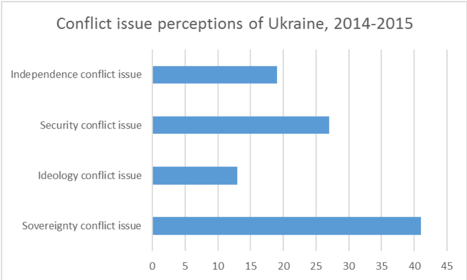
Graph 1: Conflict issue perceptions of Ukraine, 2014-2015

As it can be seen, the sovereignty conflict issue dominates in the overall conflict issue perceptions. Because of the Russian annexation of the Crimea peninsula and territorial losses in the East, the Ukrainian leaderships express most claims to Russia regarding territorial issues in order to get back sovereignty over these territories.