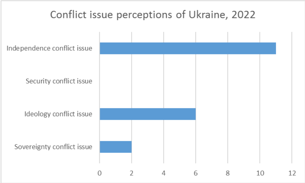
Graph 2: Conflict issue perceptions of Ukraine, 2022

The second graph shows conflict issue perceptions of the Ukrainian leadership (president Volodymyr Zelenskyy) since the beginning of 2022, before the Russian full-scale invasion of Ukraine and during the invasion. For this period of time there were only 19 statements about conflict issues of Ukraine as a conflict party. As it can be seen, there are many differences comparing with the previous period. First of all, the security conflict issue is not significant at all. At the beginning of the conflict, the security issue was the second most important conflict issue. It can be explained through understanding of the political and security situation in Ukraine. Comparing with the situation in 2014, Ukraine became military stronger and the society became more consolidated therefore any attempts to destabilize the Ukrainian state using hybrid war instruments were not successful. Most important conflict issue became the independence conflict issue. The Russian full-scale invasion creates a significant threat of the independent existence of the Ukrainian state. It is also necessary to mention that this conflict issue is definitely much more important from the Ukrainian leadership's point of view than others.