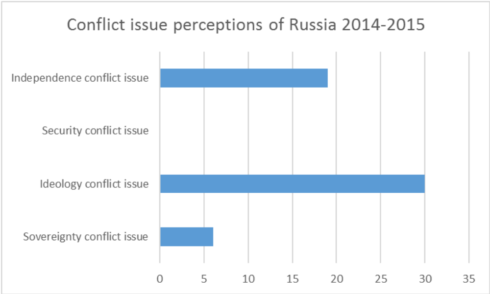
Graph 3: Conflict issue perceptions of Russia, 2014-2015

As it can be seen from the graph 3, the ideology conflict issue is dominated over other conflict issues. The ideology conflict issue of the Russian conflict party is exhibited by the super power rivalry between the West and Russia. In the context of the Russian conflict issue perceptions, Ukraine is a battleground of the confrontation against the West. At the same time, in the Russian leadership’s point of view, Ukraine as a part of the West is an existential threat of Russia. Through the conflict against Ukraine, Russian leadership tries to confront the West therefore the Russian-Ukrainian conflict in the Russian point of view is primarily a war against the West.