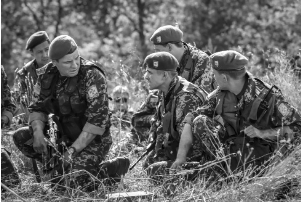
Кадр з фільму «Мирний-21». Режисер Ахтем Сеїтаблаєв. 2021.