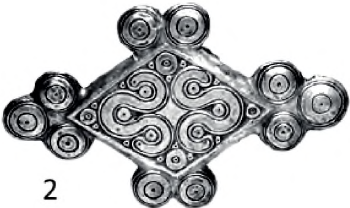
Рис. 3. 1 – Бородінський скарб; 2 – Мікени.