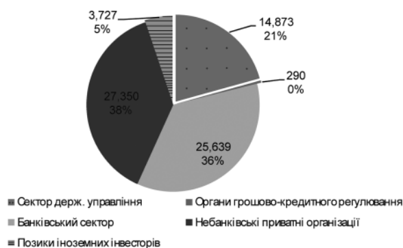
Рис. 4. Структура іноземного довгострокового боргу України станом на 30 червня 2008 р.

Зростання обсягів іноземних позик неunikно призводить до збільшення пов'язаних із даним процесом фінансових ризиків: валютних, фінансових, політичних. Зокрема саме наявність значної зовнішньої заборгованості банківського сектору (понад 25 млрд дол. США на 30 червня 2008 р.), яку потрібно регулярно обслуговувати, та неможливість отримувати нові кредити в умовах фінансової кризи спричинили дефіцит долара США на міжбанківському валютному ринку й значну девальвацію національної грошової одиниці. Ще до кризи 2008–2009 рр. експерти дійшли висновку, що головні ризики для України, пов'язані із зовнішніми позиками, сконцентровані у банківському (понад 54 % усіх кредитів у 2007р.), а не реальному секторі. Головні ризики, пов'язані з приватними позиками українських фінансових установ, полягають не в їх обсязі, а в темпах зростання кредитів протягом 2004–2007 рр. [6, с. 5], які тоді щороку збільшувалися на понад 200 %.