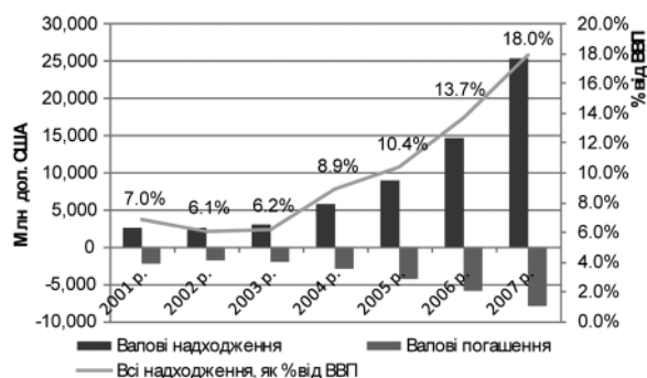
Рис. 3. Динаміка валових надходжень і виплат за всіма іноземними кредитами протягом 2001–2007 рр. в Україні

із яких на довгостроковий припадало 72 млрд дол. США. Аналіз останнього в розрізі позичальників станом на 30 червня 2008 р. наведено на рис. 4.