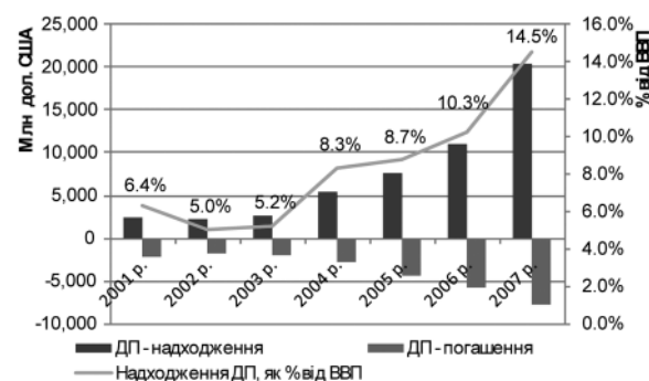
Рис. 2. Динаміка валових надходжень і виплат за іноземними довгостроковими позиками протягом 2001–2007 рр. в Україні

них довгострокових позик до ВВП збільшився з 6,4 % у 2001 р. до майже 15 % у 2007 р. (див. рис. 2). Протягом 2001–2007 рр. відбувалося нагромадження зовнішнього довгострокового боргу: валові надходження кредитів перевищували виплати за позиками, отриманими раніше. В умовах фінансової кризи, коли відсутні кошти для підтримки національної економіки, що у стані стагнації, необхідно здійснювати обслуговування значного зовнішнього боргу, що на 30 червня 2008 р. становив понад 100 млрд дол. США, у т. ч. близько 30 млрд дол. короткострокових кредитів [8, с. 62].