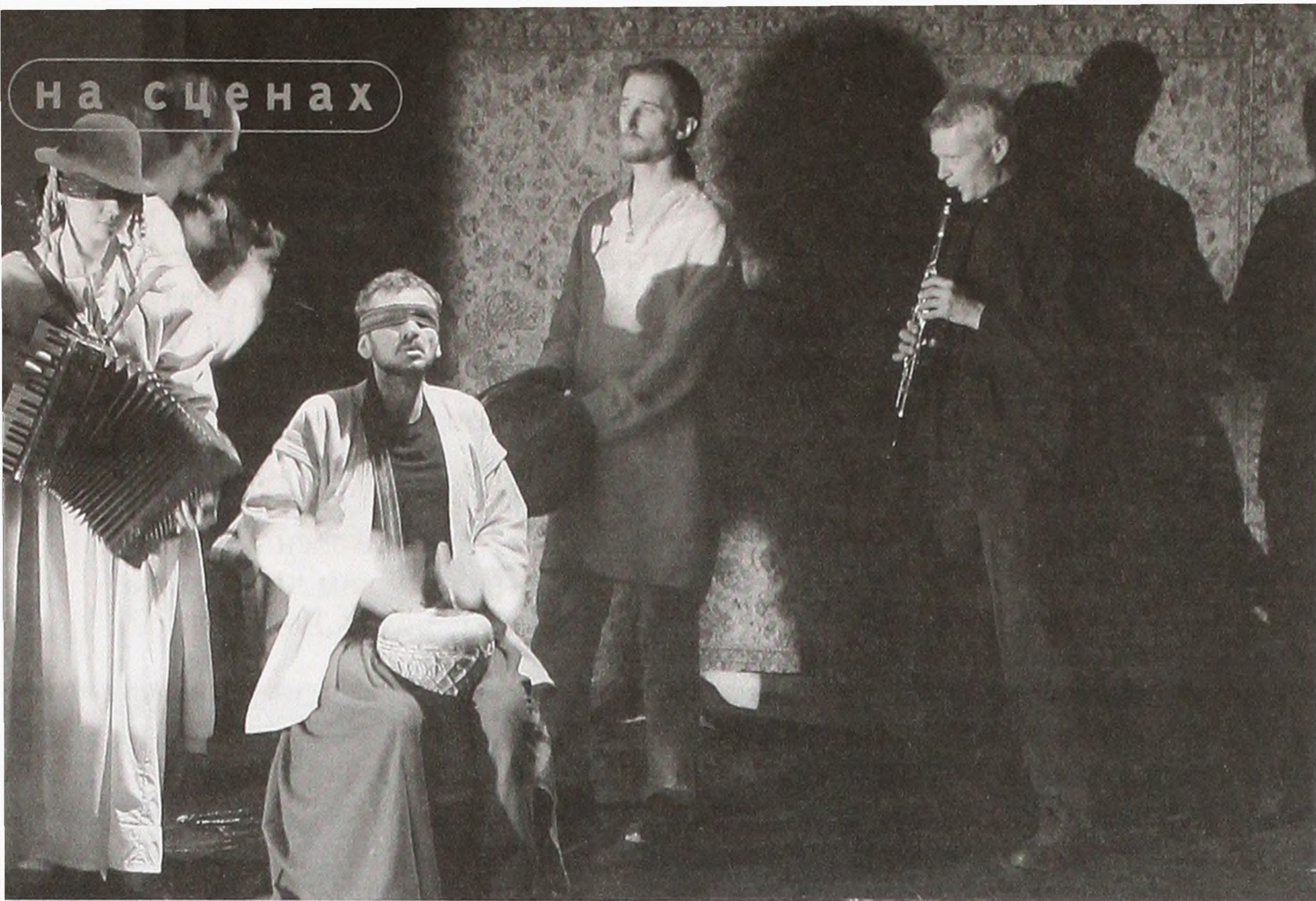
Сцена з вистави «Богдан» за п'єсою Кліма.