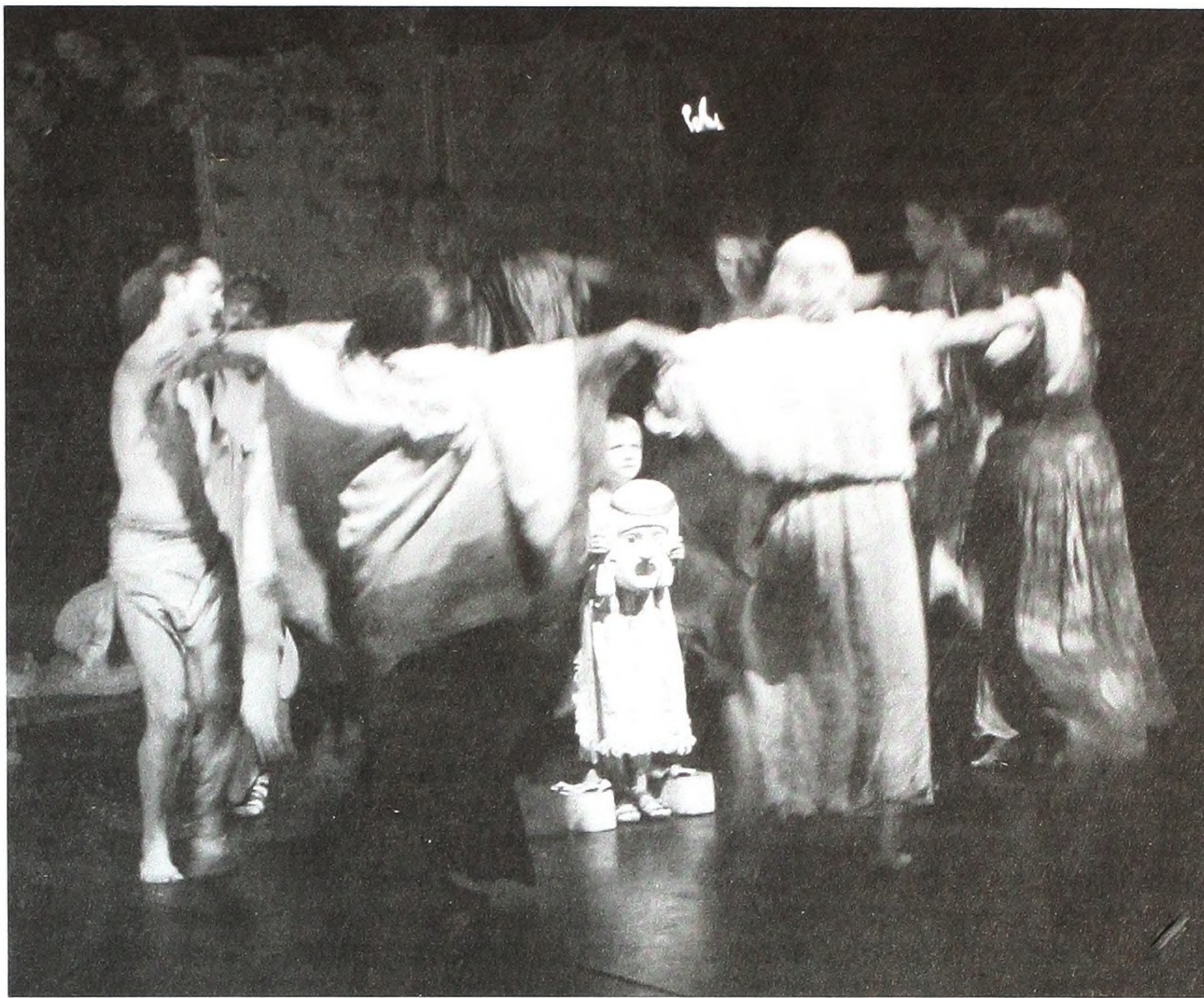
Сцена з вистави «Хвала Еросу» за «Бенкетом» Платона.