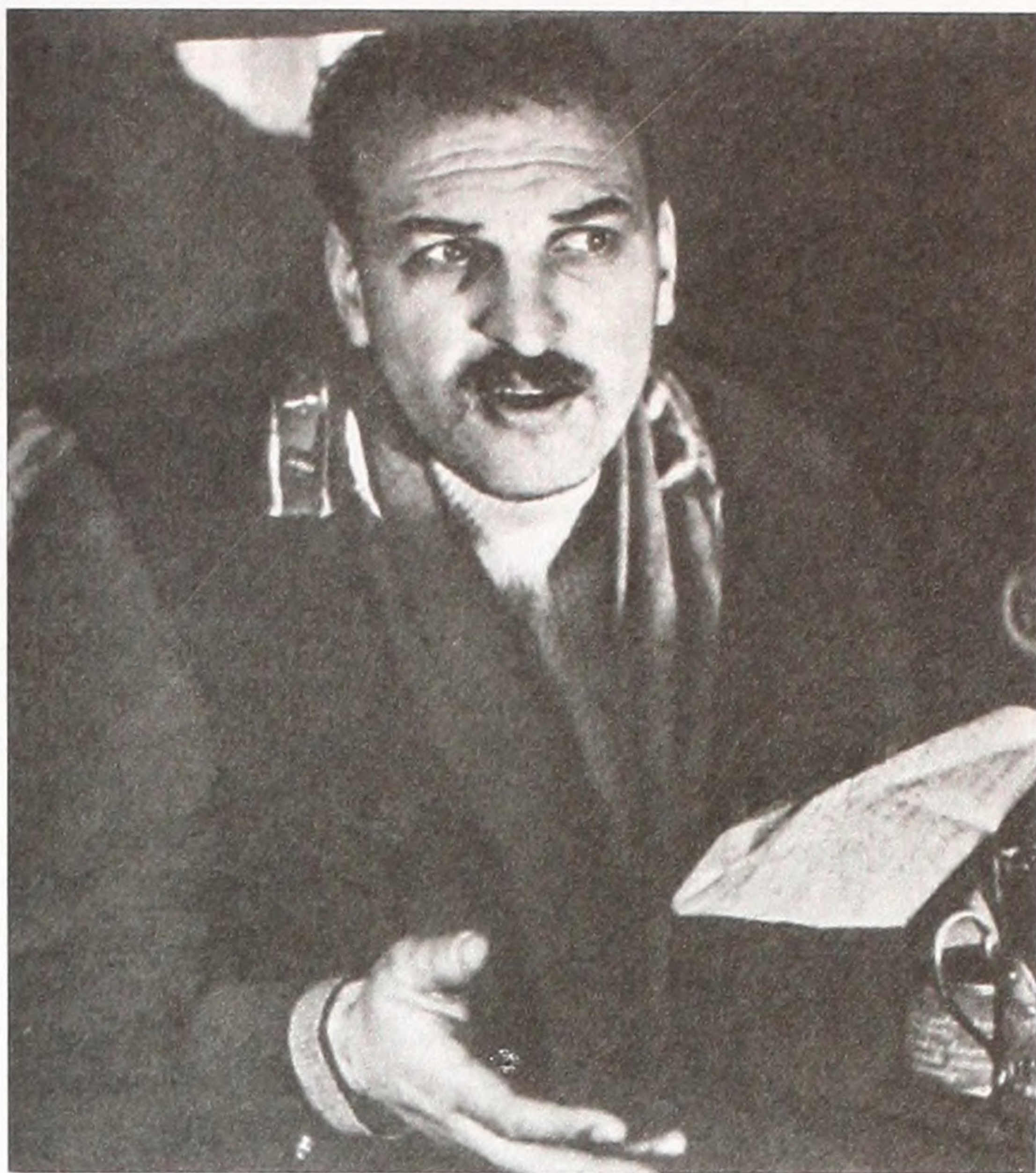
Олексій Петренко у фільмі «Двадцять днів без війни». Режисер Олексій Герман.

Великий російський актор М. Щепкін (аналогії з яким