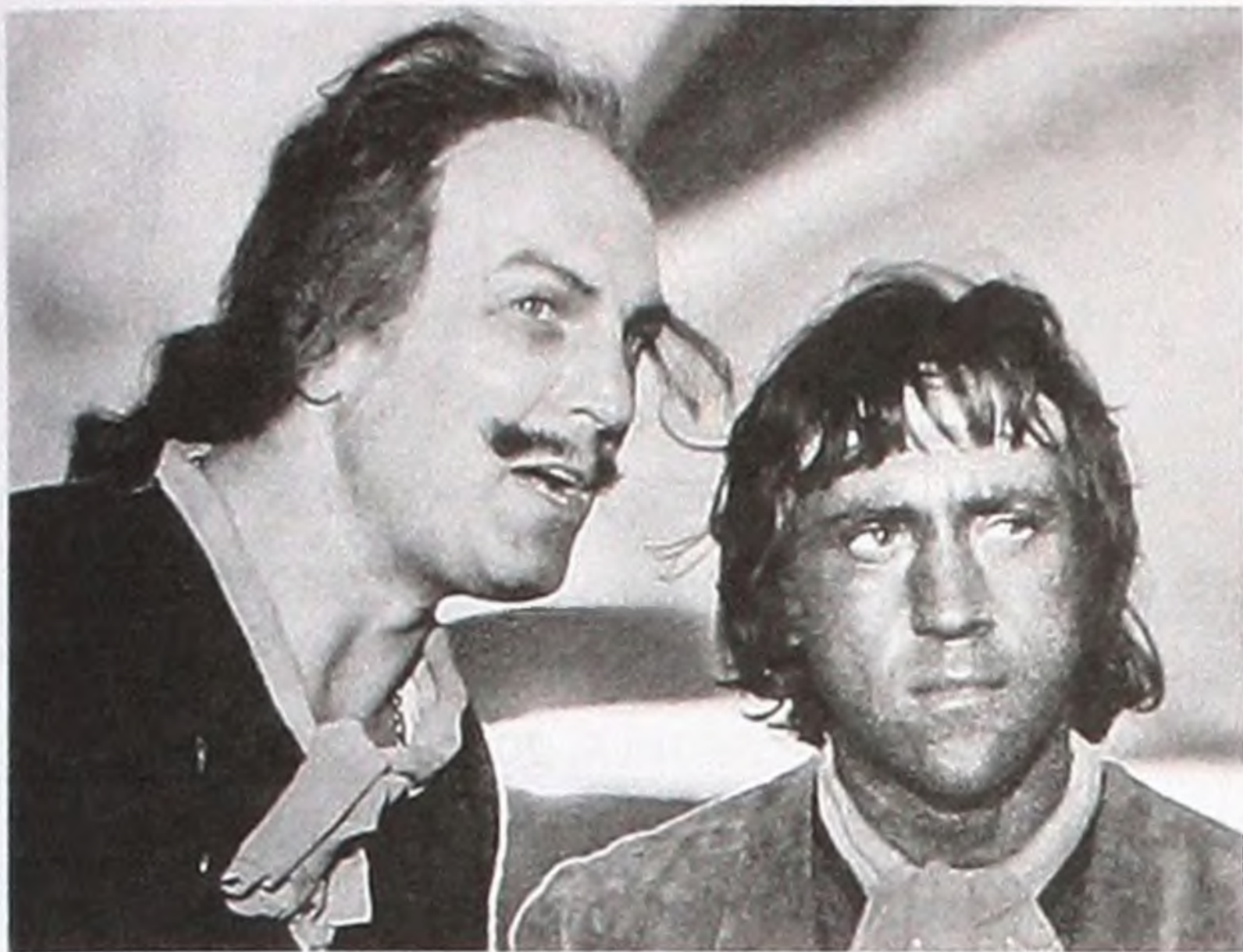
Олексій Петренко та Володимир Висоцький у фільмі «Сказ про те, як цар Петро». Режисер Олександр Мітта. «Мосфільм», 1976.