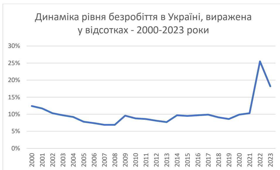
Рисунок 2.4 Динаміка рівня безробіття в Україні, виражена у відсотках - 2000-2023 роки

Оскільки метою дослідження є оцінка впливу обсягів міжнародної допомоги на рівень безробіття в Україні, окрім розмірів фінансування потрібно проаналізувати щорічну динаміку рівня безробіття. Наочно це виведено на рисунок 2.4.