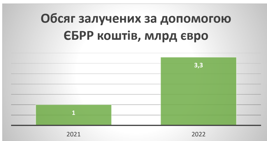
Рисунок 2.1 Обсяг залучених за допомогою ЄБРР коштів, млрд євро