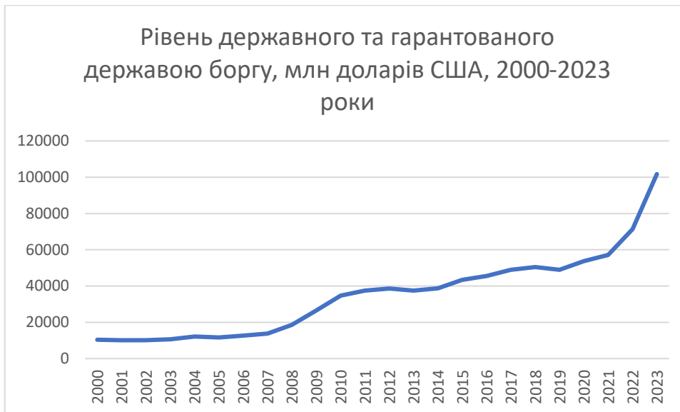
Рисунок 3.1 Рівень державного та гарантованого державою боргу, млн доларів США, 2000-2023 роки

Джерело: складено автором на основі [27]