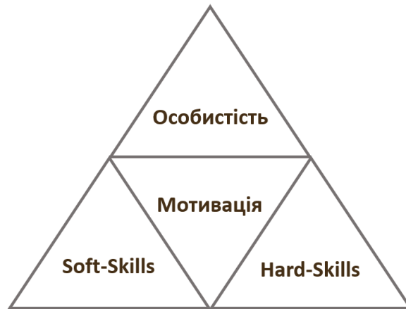
Рис. 1. – Мотиваційна схема розвитку особистості П. Мосс та С. Тіллі. Джерело: [1]

Інша категорія умінь, які необхідні для професійного становлення людини — digital skills , що визначають широкий спектр навичок використання цифрових технологій, від ефективної комунікації у соціальних мережах до впровадження технологій нейронних мереж, зокрема роботи з ChatGPT [16]. Моніторинг наукової літератури з теми професійного та особистісного розвитку людини виявив наявність додаткової категорії навичок meta skills , що описує якості, які сприяють навчанню людини, допомагають їй краще засвоювати нову інформацію, впливають на мотивацію до особистісного та професійного розвитку [54]. Серед meta skills соціальний та емоційний інтелект, когнітивна гнучкість та креативність. Кожна з цих рис позитивно впливає на адаптивність людини до нового колективу, кращу інтеграцію у корпоративну культуру, швидше засвоєння професійних вмінь та гнучкість у побудові комунікативних стратегій [50]. Відповідно до цього, розвиток meta skills вкрай важливий для університетської підготовки майбутніх фахівців та підсилення кадрової безпеки підприємств, оскільки молоді співробітники швидше знаходять спільну мову з колективом, краще опанують професійні вимоги.