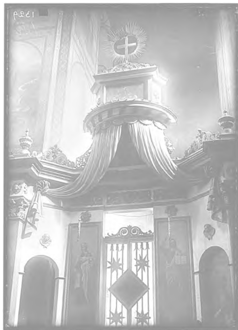
9. Центральна частина іконостаса Предтеченського приділу Богоявленського собору.

Світлинні іконостаса виявляють також, що після неодноразових переробок і оновлень його декоративне оздоблення втратило властиву класицизму підпорядкованість архітектурним формам і лаконічність орнаменталії. Хоча в іконостасі збереглися первинні скульптурні деталі: барельєфні фризи, капітелі, розетки та гірлянди, до них додалися численні різьблені і живописні орнаментальні композиції, що покривали щільним ажурним шаром його площини. Ці додатки вносили до художнього образу пам'ятки надмірну «красивість»,