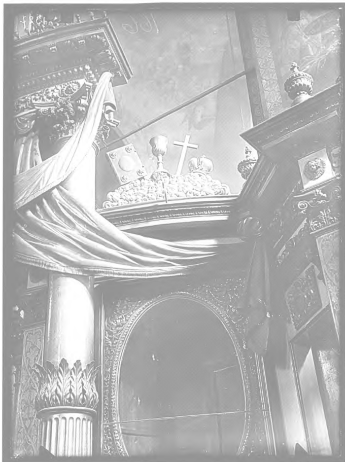
7. Частина правого крила іконостаса з обрамленням від намісної ікони Спасителя Богоявленського собору