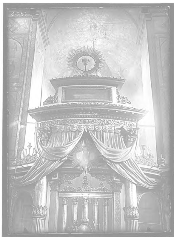
5, 6. Центральна частина іконостаса Богоявленського собору

розташовані два чотирикутні стовпи з капітелями коринфського ордеру. Царські врата також розміщені між двох колон коринфського ордеру величезного розміру. Зверху цих колон спускається дерев'яна золочена завіса, що розкривається на два боки і закінчується по боках вишукано зав'язаними вузлами, оздобленими китицями. На тому місці над царськими вратами, де завіса розходить на обидва боки, міститься у сяйві Феофанів хрест. Над цією завісою розміщена інша, така сама, але менших розмірів. Вище знаходиться білий, висунутий вперед архітрав із золоченими ажурними орнаментами. Над ним вміщено зображення Таємної Вечері. Горішню частину утворює такого ж вигляду, однак менших розмірів архітрав, на якому в сяйві стоїть чаша.