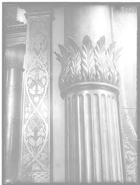
8. Фрагмент оздоблення центральної частини іконостаса

світлинні іконостаса Предтеченського вівтаря можна бачити, що балдахін увінчаний надбудовою у вигляді аттика, в який вставлена ікона. Вище ж цю конструкцію вінчає хрест. На кресленні така надбудова над балдахіном відсутня і хрест установлений безпосередньо на його карнизі. По-іншому організовано також проріз центральних царських врат. Тут очевидна зміна пропорції усієї конструкції, оскільки на кресленні архітрав врат піднятий майже до рівня горизонтального карнизу, що обмежував зверху прямокутну арку центрального проходу. Вузький проміжок, який залишався між архітравом і карнизом, був майже закритий декоративним оздобленням, розміщеним уздовж архітрава царських воріт. На світлинні ж бачимо, що отвір між архітравом і карнизом удвічі більший і декор розміщений не тільки на архітраві, а й по кутах арки. Окрім конструктивних можна нарахувати інші розбіжності іконографічного та декоративного характеру. Зокрема, центральний іконостас увінчує потир, накритий малим покрівцем в оточенні променів, тоді як на кресленні, наскільки дозволяє роздивитися зображення, його вінчає хрест. Також різняться обрамлення намісних ікон Спасителя і Богородиці, які на кресленні овальні, а в іконостасі – прямокутні з овальними прорізами під ікони.