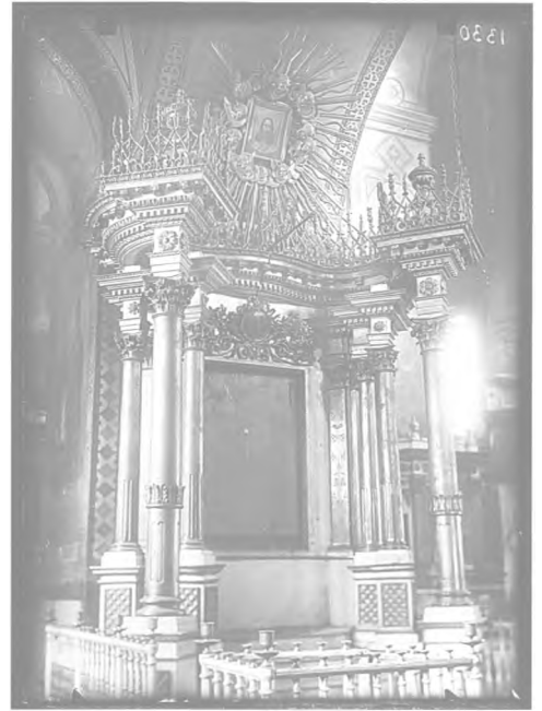
14. Кіот біля північного стовпа Богоявленського собору

Дослідження знайденого фотоматеріалу схиляє до висновку, що це світлини, виконані в лютому 1935 року фотографом Київської обласної інспектури охорони пам'яток культури С.І. Притикіним перед руйнуванням собору 22 . Невідомо, чи існують інші світлини собору або його інтер'єру, виконані тоді ж С.І. Притикіним, однак навіть цей матеріал істотно розширює наші знання про характер опорядження інтер'єру Богоявленського собору, відкриваючи можливість для подальших досліджень цієї пам'ятки.