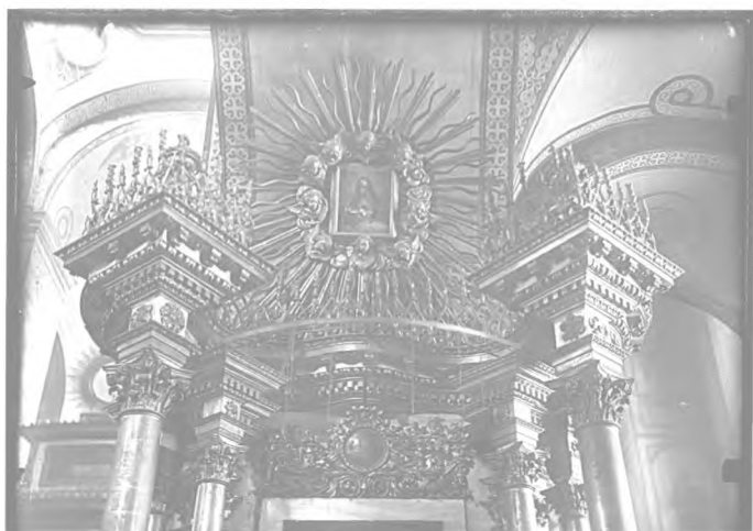
10–13. Фрагменти кіоту біля південного стовпа Богоявленського собору

контрастуючи зі стриманістю оздоблення первинного задуму. Основним мотивом уведених декоративних деталей була виноградна лоза: плетивом її пагонів розписані фусти колон і пілястр, з неї вирізані ажурні вставки обабіч балдахинів у бічних навах. Пишні обрамлення для намісних ікон Спасителя і Богородиці, очевидно, також з'явилися в результаті спроб «покращання» іконостаса. Поєднання в них мотивів аканту, виноградних ґрон, стилізованих мушель, п'ятипелюсткових квітів і лаврового листа видають їх належність до еклектичного декору середини – другої половини XIX століття.