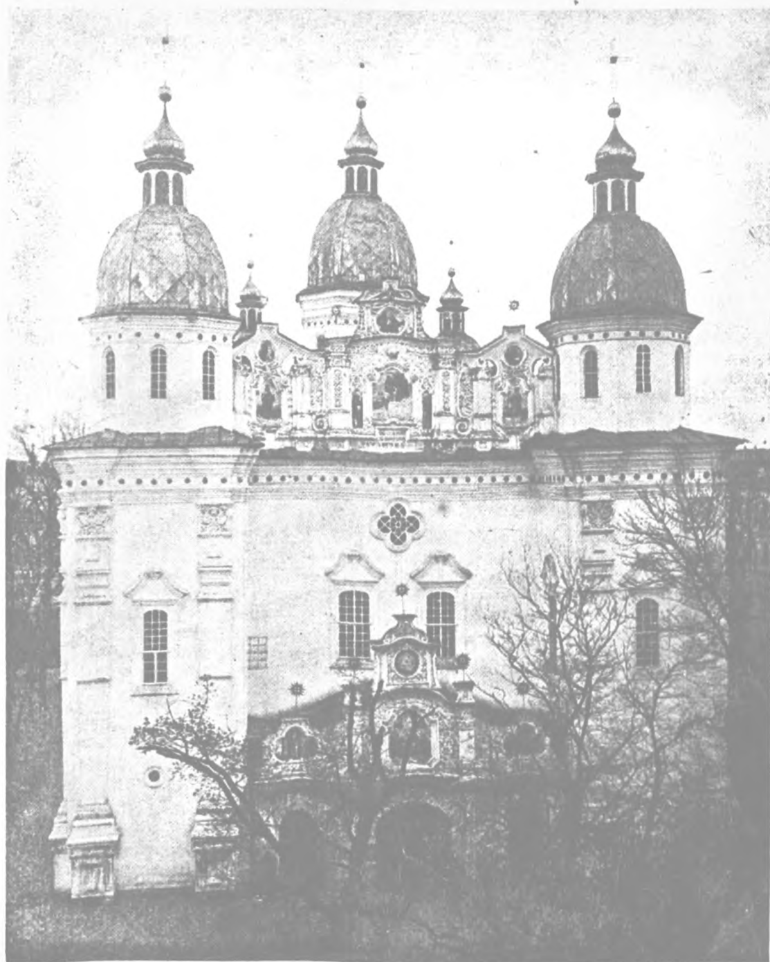
1. Богоявленський собор Братського монастиря. 1690–1693 рр.