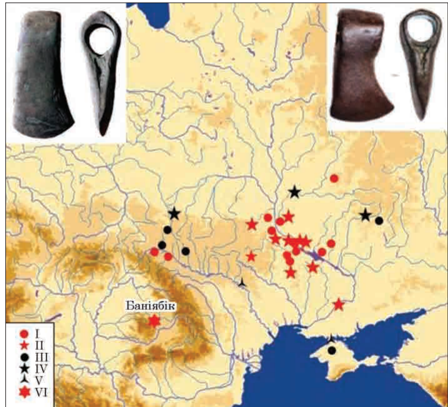
Рис. 9. Мапа сокир типу Баніябик: I — варіант Гречаники; II — варіант Підлісся; III — варіант Рудня Мала—Маліївці; IV — варіант «сокири лісорубів»; V — варіант «сокири теслярів»; VI — скарб Баніябик

с. Рудня Мала Жешовського воєводства Польщі (Клочко 2006, рис. 50: 1), с. Маліївці Дунаєвського р-ну Хмельницької обл. (Клочко, Ко-