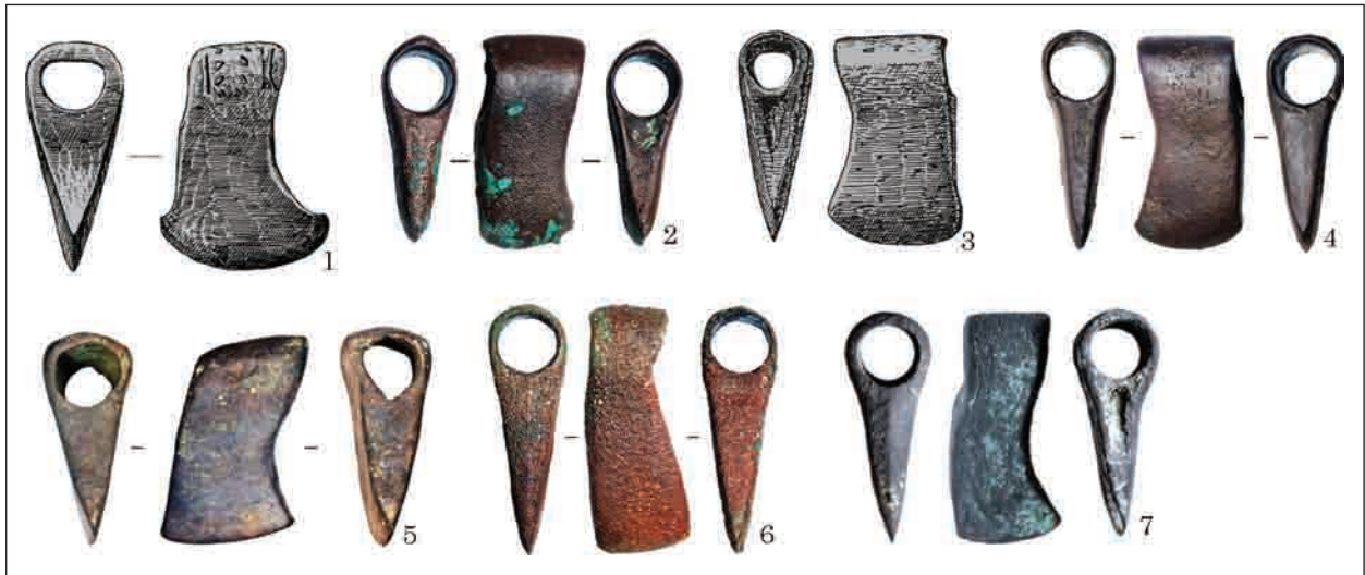
Рис. 6. Варіант Рудня Мала — Маліївці: 1 — НМІУ; 2 — Теробовлянський р-н; 3 — Рудня Мала; 4 — Маліївці; 5 — Степовий Крим; 6 — Вороновиця; 7 — Харків