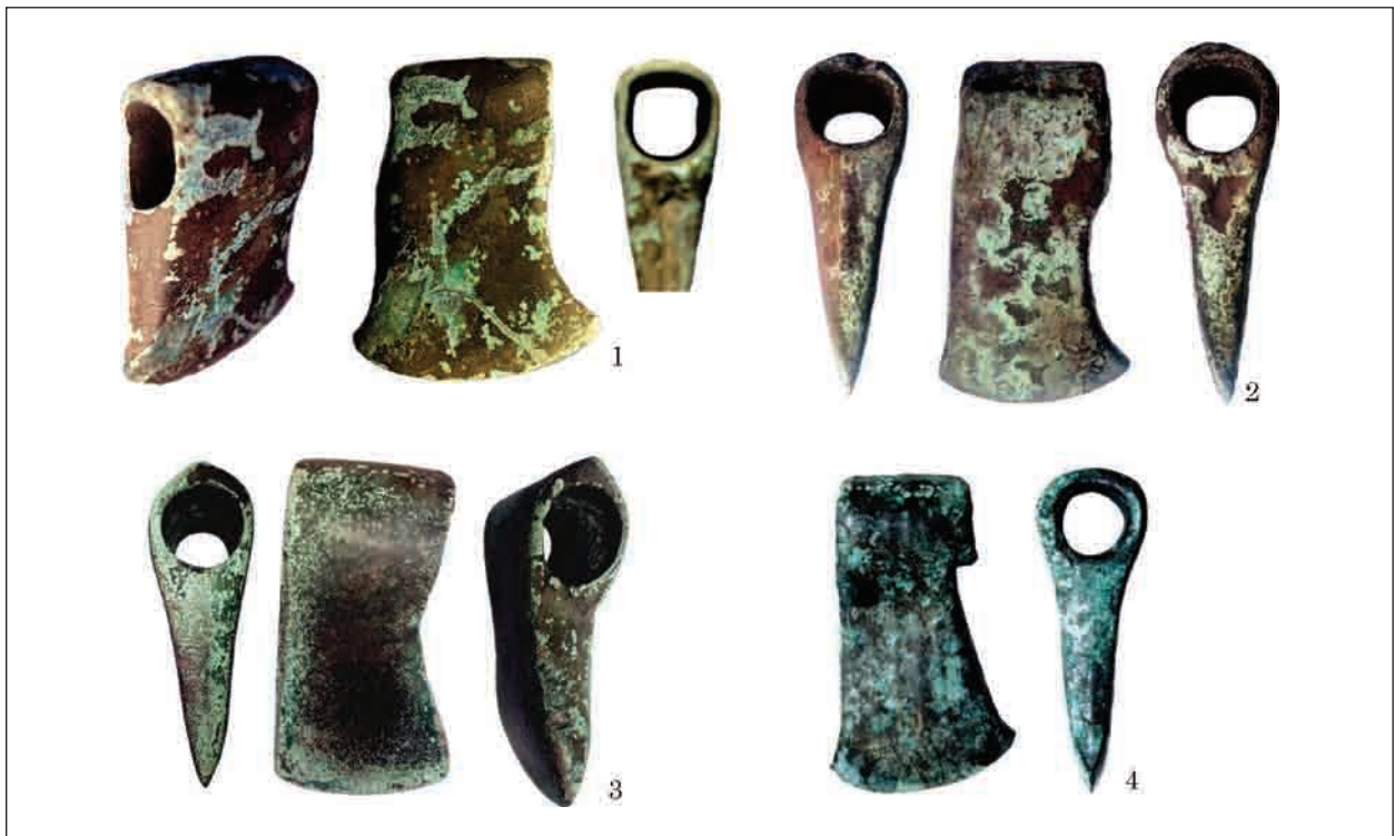
Рис. 7. Варіант «сокири лісорубів»: 1 — Чернігівщина; 2, 3 — Харківська обл.; 4 — Станятин, повіт Томашів Любелський, Польща

2), у Тернопільській обл. (Віоліті, 16.09.2016), м. Київ (Віоліті, 27.11.2016), Черкаській обл. (Віоліті, 27.08.2018) (рис. 4: 1—10). Сокири, знайдені біля с. Ксаверово Городищенського р-ну Черкаської обл. (Колекція А. В. Козименка, надходження 2018 р., аналіз 1783) (рис. 3: 11) та з селища Дібровка Золотоношського р-ну Черкаської обл. (Колекція А. В. Козименка, надходження 2018 р., аналіз 1782) (рис. 4: 12) виготовлені з миш'якової бронзи (рис. 9).