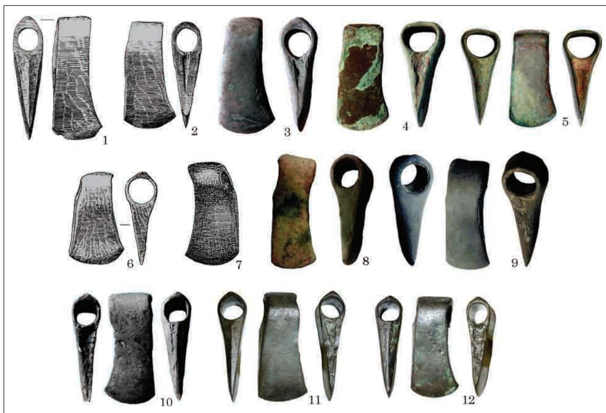
Рис. 4. Варіант Гречаники: 1 — Гречаники; 2 — Гнідин; 3 — Полтавська обл.; 4 — Сумська обл.; 5 — Черкаси; 6 — Стайки; 7 — Пістинь; 8 — Тернопільська обл.; 9 — Київ; 10 — Черкаська обл.