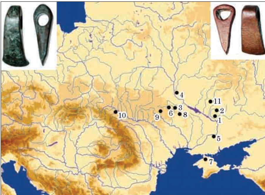
Рис. 2. Мапа сокир самарського типу

матриці, розташовану з «внутрішнього» боку сокири — техніка лиття у відкрите «черевце» (рис. 1: 1, 2).