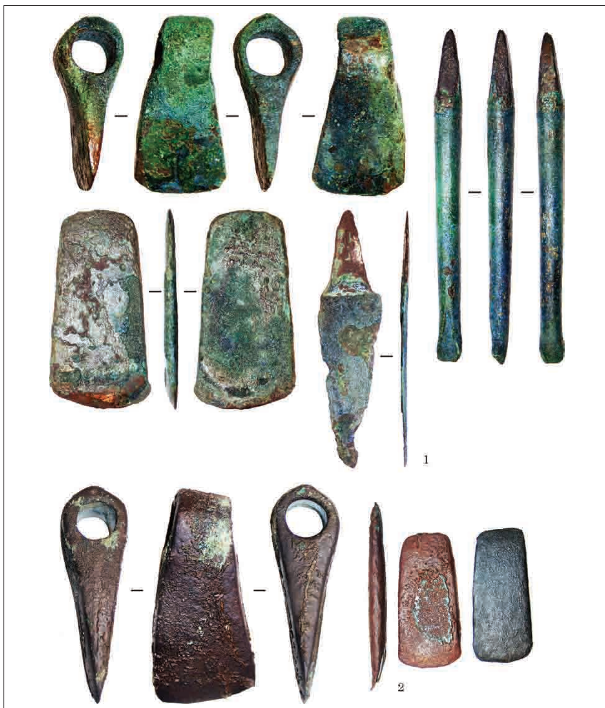
Рис. 8. Варіант «сокири теслярів»: 1 — Красноперекопськ; 2 — Івонівський скарб

2017, 2.1.1, аналіз 1826) (рис. 6: 3), біля смт Макарів Київської обл. (Віоліті, 26.12.2016), села Чапаївка Золотоніського р-ну Черкаської обл. (Клочко 2006, рис. 25: 3), на «Київщині» (Клочко 2006, рис. 25: 1), біля с. Гришинці Канівського р-ну Черкаської обл. (Клочко 2006, рис. 25: 4) (рис. 5: 4—7), біля с. Смільчинці Лисянського р-ну Черкаської обл. (Клочко, Козыменко 2017, 1.3.3, аналіз 1695) (рис. 5: 8), біля с. Вишківці, Немирівського р-ну Вінницької обл. (колекція А. В. Козименка, надходження 2018 р., виго-