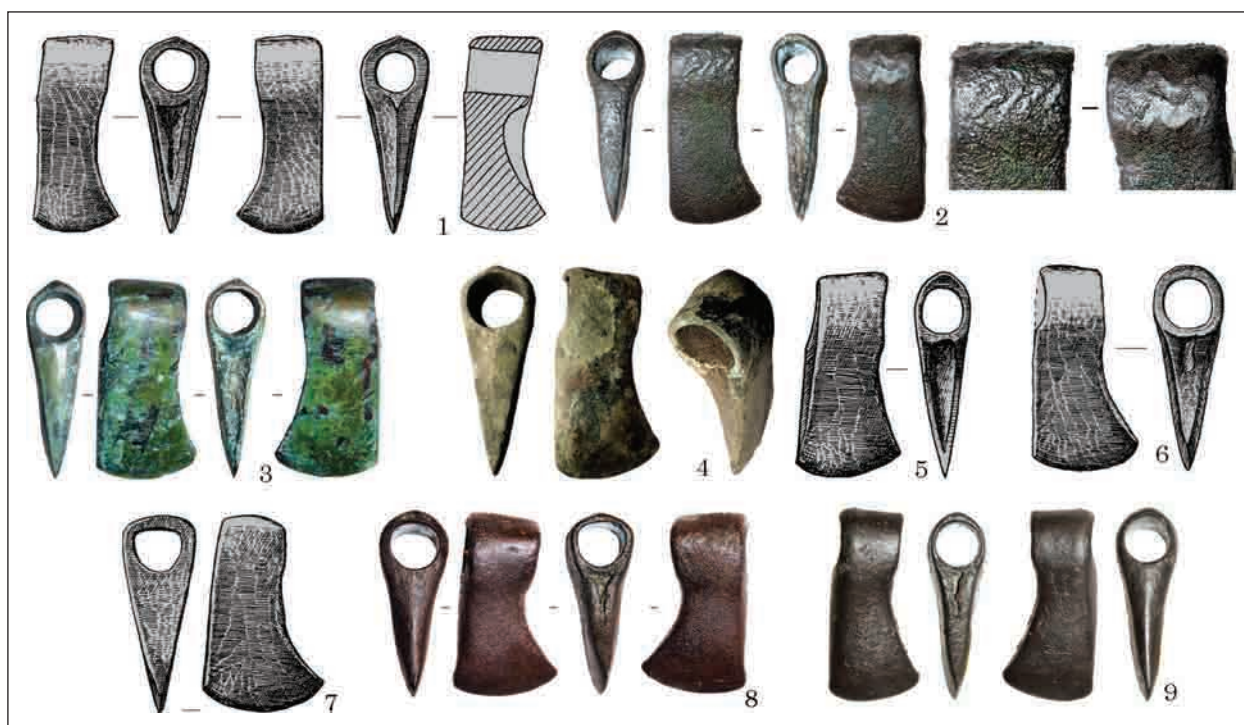
Рис. 5. Варіант Підлісся: 1 — Підлісся; 2 — Світловодськ; 3 — Кедина Гора; 4 — Макарів; 5 — Чапаївка; 6 — «Київщина»; 7 — Грищинці; 8 — Смільчинці; 9 — Вишківці

Полтавській обл. (Віоліті, 24.06.2016), у Сумській обл. (Віоліті, 09.04.2017), біля м. Черкаси (Віоліті, 21.04.2017), біля с. Стайки Кагар-