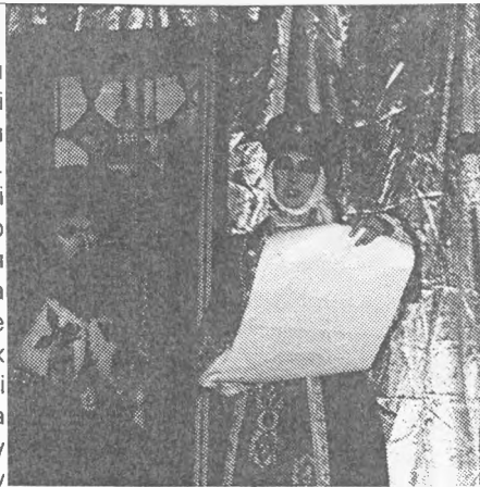
Галшка оголошує свій заповіт

Пахльовська показала, як будь-який завойовник нищив в Україні насамперед «монолітне осердя інтелектуального космосу нації». Але, додаю, саме це справді «монолітне осердя» завжди було живим і тому не піддавалося знищенню. Та ж сама Оксана Пахльовська блискуче показала це порівнянням постатей двох могилянців - Івана Мазепи і Теофана Прокоповича. Мазепа прокладав шлях українському розуму до визвольних революцій у Європі, до свободи нації.