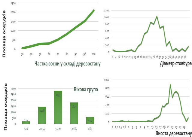
Рис. 3. Графік залежності площі осередків усихання від стану деревостану