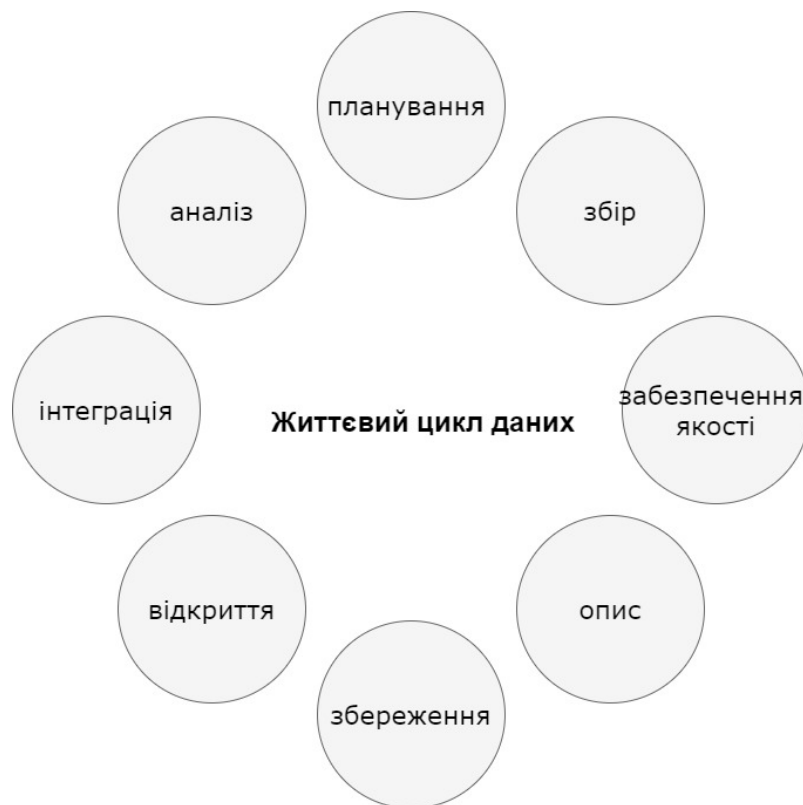
Схема 1. Життєвий цикл даних – версія DataONE [5]

Отже, як бачимо, на етапі збереження виникає потреба у виборі надійного архіву, щоб можна було забезпечити захист даних і у той самий час доступ до пакетів даних. Кетрін МакНіл зазначає, що більшість досліджень може ґрунтуватись на повторному використанні раніше зібраних даних. Таке використання та обмін даними можливий лише за умов ефективного використання репозитаріїв [9, с.15].