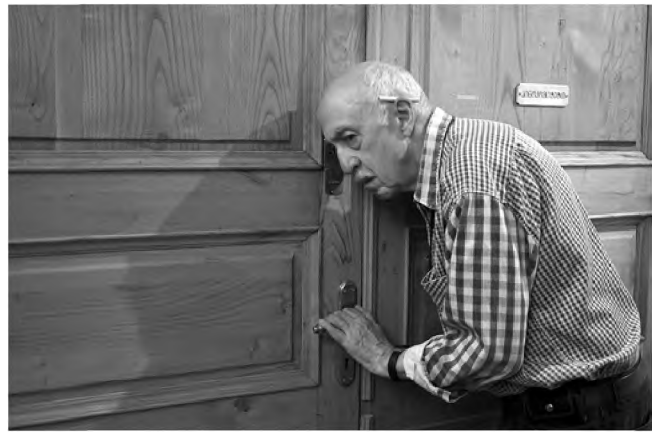
Отар Іоселіані у фільм «Шантрапа». Франція, Грузія. 2009.

У конкурсній документальній програмі «Період історії», що завжди відзначається підбором найцікавіших і найгостріших стрічок з усього світу, серед 20 повнометражних робіт премію здобув фільм «Печера» (Сирія–Данія–Німеччина–США–Катар) сирійського режисера-документаліста Фера-