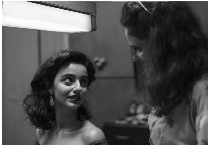
«Невидиме життя Еврідіки Гусман». Режисер Карім Айнуз. Бразилія-Німеччина. 2019.