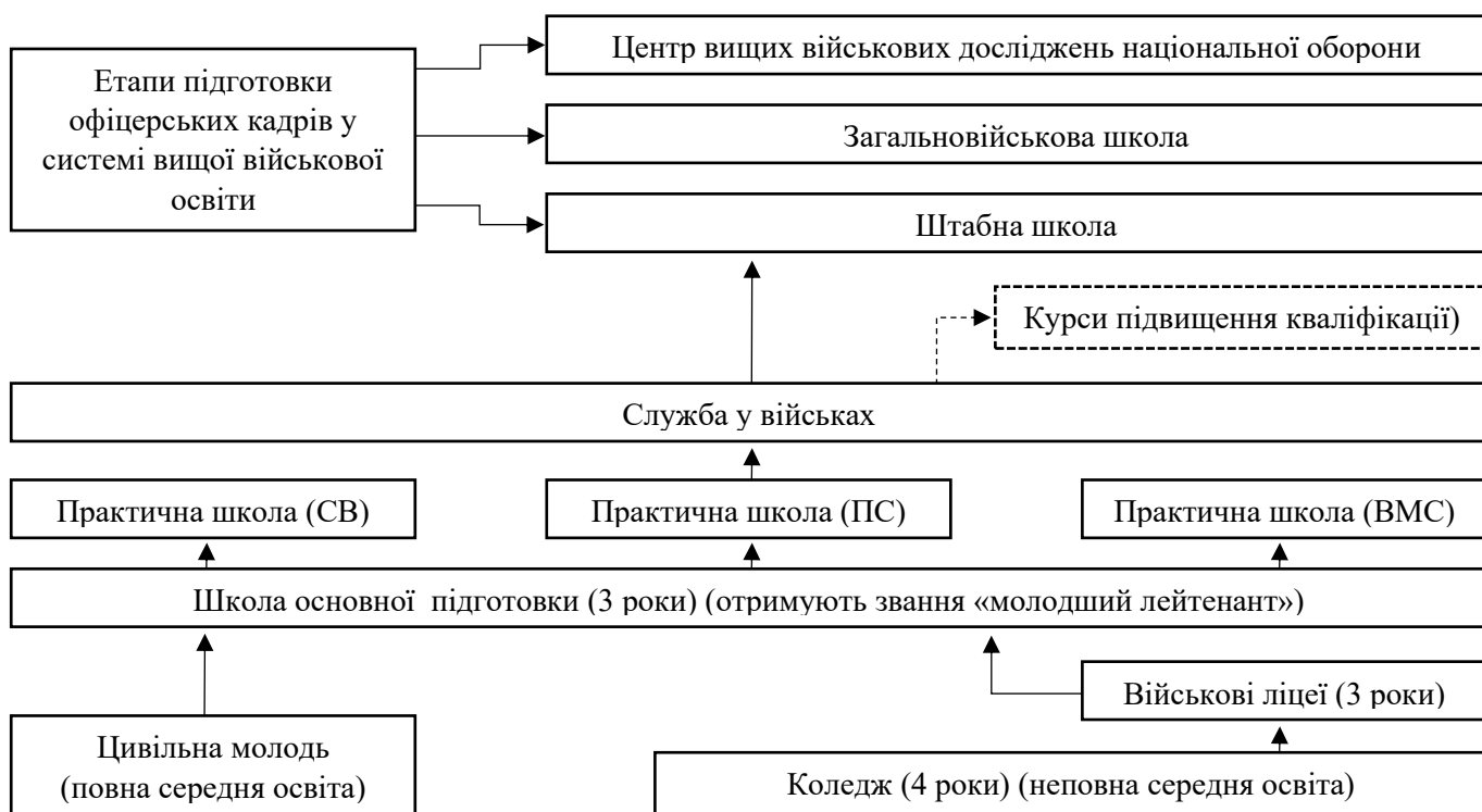
Рис. 1.1. Структура підготовки офіцерських кадрів Збройних Сил Франції (Брижатий, 2012)

У Франції військова підготовка реалізуються двома шляхами (Брижатий, 2012): у військових ліцєях (ліцєях оборони, з франц. “Les lycées de la défense”), за наявності неповної середньої освіти, та у школах основної підготовки для цивільної молоді з повною середньою освітою (рис. 1.1).