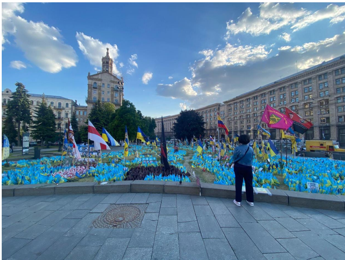
Рис. 3.3. Жінка споглядає стихійний меморіал на Майдані.

Людина, котра переступає окреслену межу, зазвичай йде предметно вшановувати пам'ять конкретної людини, а не просто розглядає меморіал; її поведінка в цьому окресленому просторі дуже нагадує загально прийняту поведінку на кладовищі: вона рухається стежкою, чітко знаючи орієнтири місця вшанування пам'яті людини, до якої вона прийшла, дорогою вона розглядає простір (ймовірно, на предмет появи нових прапорців), несе квіти, порається біля своєї ділянки, інколи замінює вицвілий прапорець на новий. Люди, які не мають наміру вшановувати пам'ять когось конкретно, як правило, споглядають меморіал осторонь, не перетинаючи межу. І це також для мене видається таким аспектом, який підсилює паралелізацію із кладовищем.