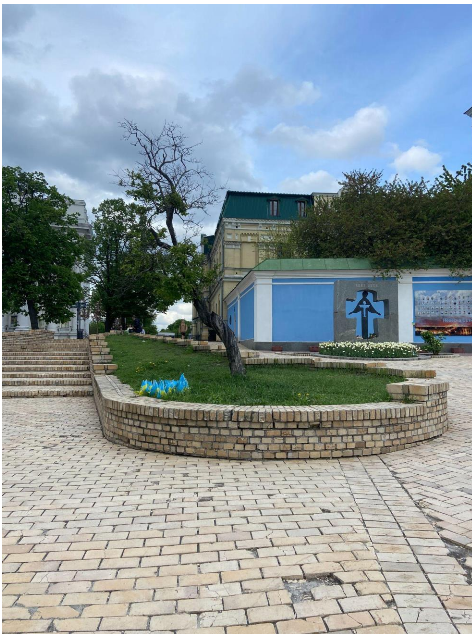
Рис. 3.12. Купка прапорців на Михайлівській площі.