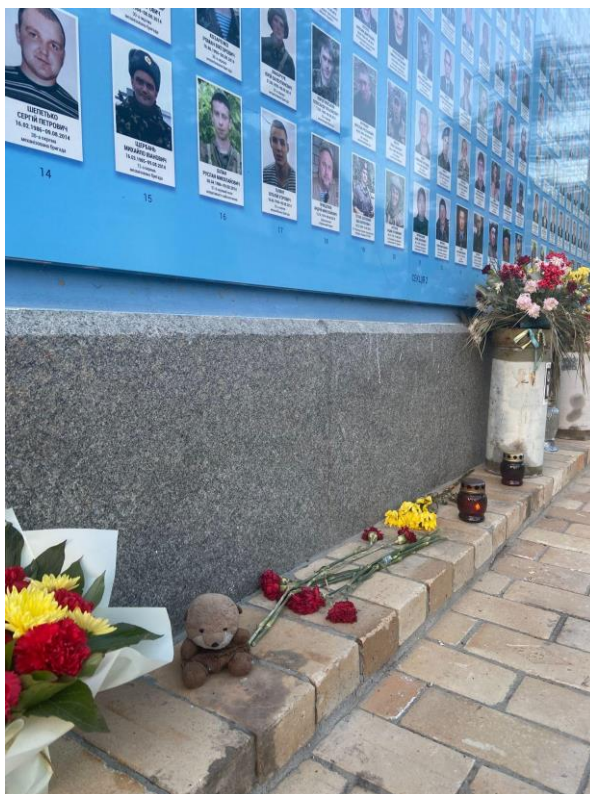
Рис. 3.2. Комеморативні атрибути під стіною пам'яті біля Михайлівської площі.

Дуже примітно, що свічки в лампадках здебільшого запалені, а квіти біля стіни – винятково живі і свіжі, і йдеться не лише про букети, а й про поминальні вінки. Зів'ялих квітів мені не траплялося, що свідчить про постійну присутність близьких людей загиблих в цьому просторі. Мені вдалося, що в цьому квітковому комеморативному аспекті захиті важливі речі. Наприклад, може йтися про наявність певного неписаного коду належного вшанування пам'яті біля цієї стіни, згідно з яким штучні квіти суттєво програють живим. Ніхто не наважується принести штучні квіти, тому що тоді пам'ять людини, якій їх принесли, буде менш вшанованою, ніж пам'ять решти загиблих, чий світлина зберігає стіна. Крім того, живі, свіжі квіти можуть бути символом живої пам'яті і свіжої рани. Це останнє міркування підкріплюється тим фактом, що все ж таки стіна рясніє численними атрибутами меморіалізації передовсім у другій своїй половині – там, де вшанується пам'ять полеглих після розгортання повномасштабного вторгнення. Такі міркування про квіти настановлюють на паралелізацію меморіальних практик цього простору із практиками,