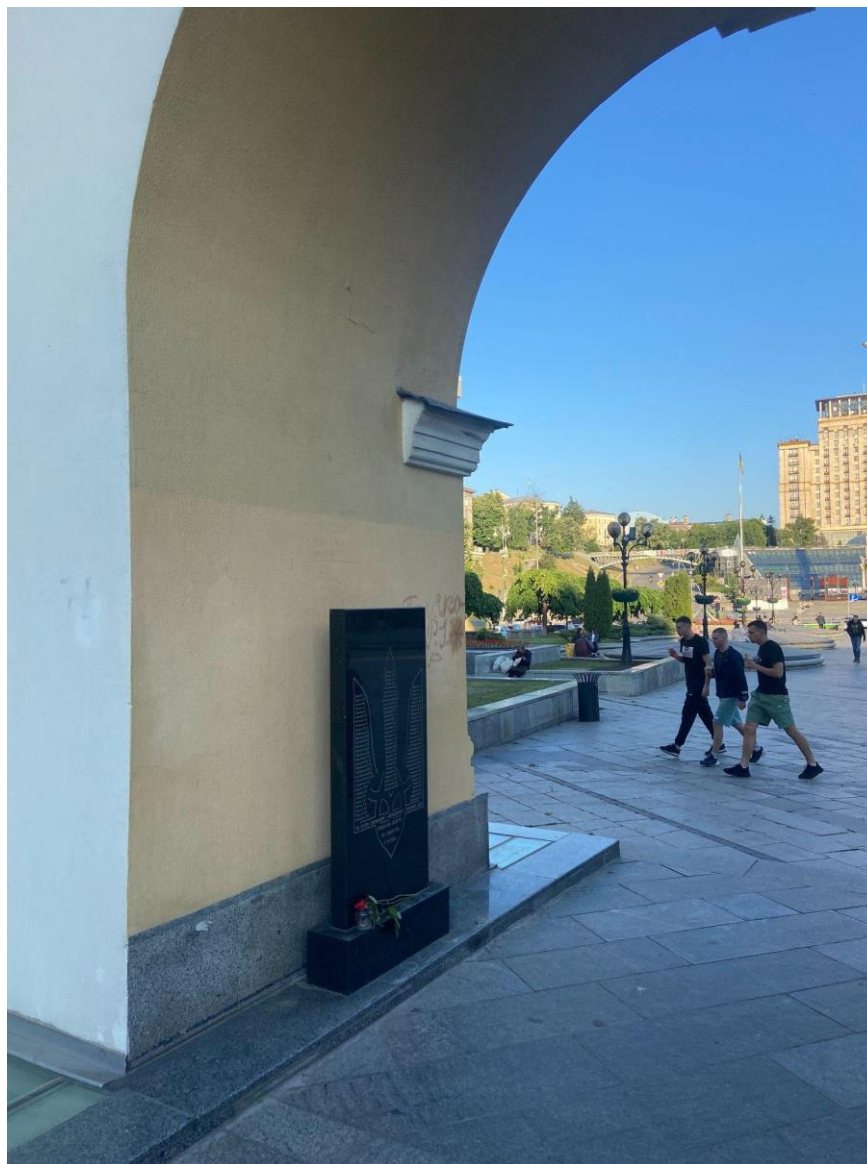
Рис. 3.5. Пам'ятна гранітна плита під «Лядськими воротами» на Майдані.

арці воріт носить характер канонічної, прямолінійної комеморативної мови гранітних пам'ятників, але від цього її посил не стає зрозумілішим, у цьому випадку – радше навпаки. Загалом такий спосіб меморіалізації вже не працює в цьому просторі, тож справді необхідні свіжі підходи, які можуть народитися лише в суспільній дискусії, про яку я вже згадувала в минулому підрозділі.