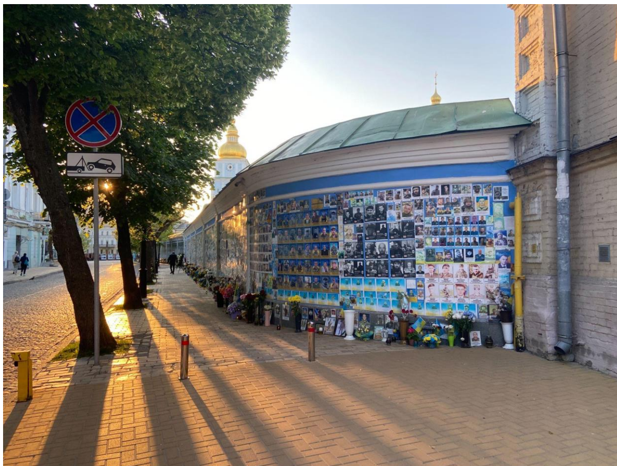
Рис. 3.1. Стіна пам'яті біля Михайлівської площі.

Додавання нових світлин носить суто стихійний характер, ніхто не веде їм рахунок. Стіна використовується доволі хаотично, оскільки люди вишуковують бодай трохи вільного місця, куди можна було б приклеїти світлину. Окрім фотографій, вшанування пам'яті здійснюється за допомогою й інших атрибутів – живих квітів, стрічок, прапорців, лампадок зі свічками, подекуди навіть маленьких іграшок.