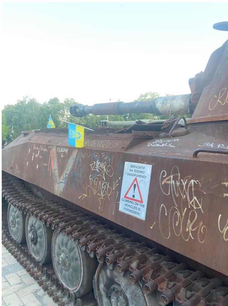
Рис. 3.7. Роздруківка «Вилазити на техніку заборонено!» на Михайлівській площі