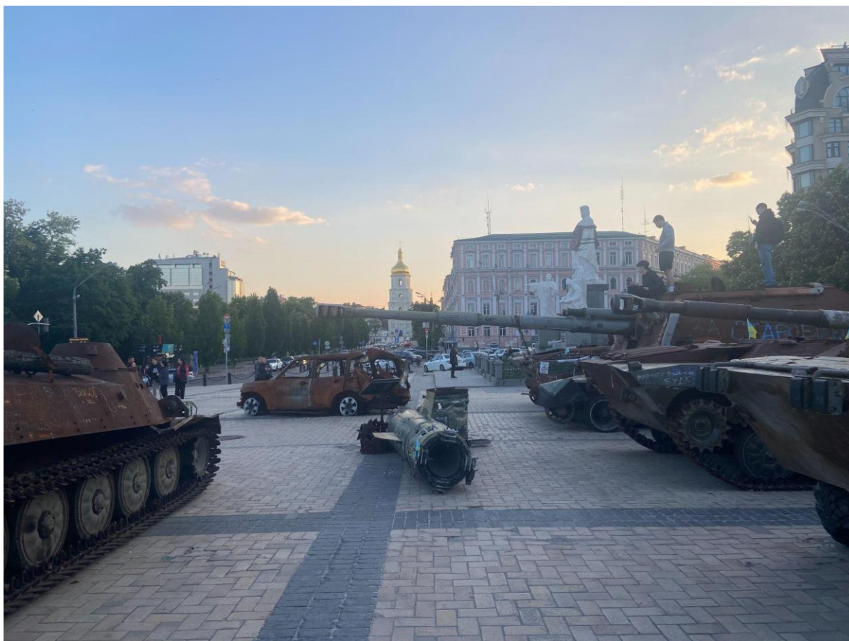
Рис. 3.8. Молоді люди зверху на розбитому російському танку на Михайлівській площі.