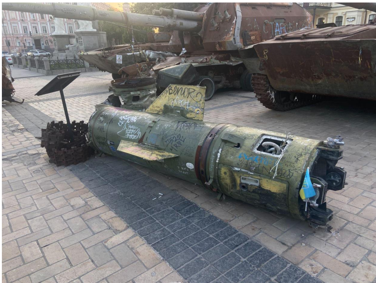
Рис. 3.9. Російська ракета в центрі інсталяції з технікою на Михайлівській площі.

шкільних вбиралень. Посеред інсталяції розміщена ракета, також повністю обписана згаданими типами повідомлень. Можна припустити, що практика залишати написи на об'єктах цієї інсталяції почалася саме з ракети, оскільки за роки повномасштабного вторгнення відкрився новий моторошний спосіб комунікації між людьми з воюючих країн – послання на ракетній зброї, яка спрямована нищити. Однак це лише запропонований мною напрямок для міркувань, точних спостережень з цього приводу дослідження не покриває.