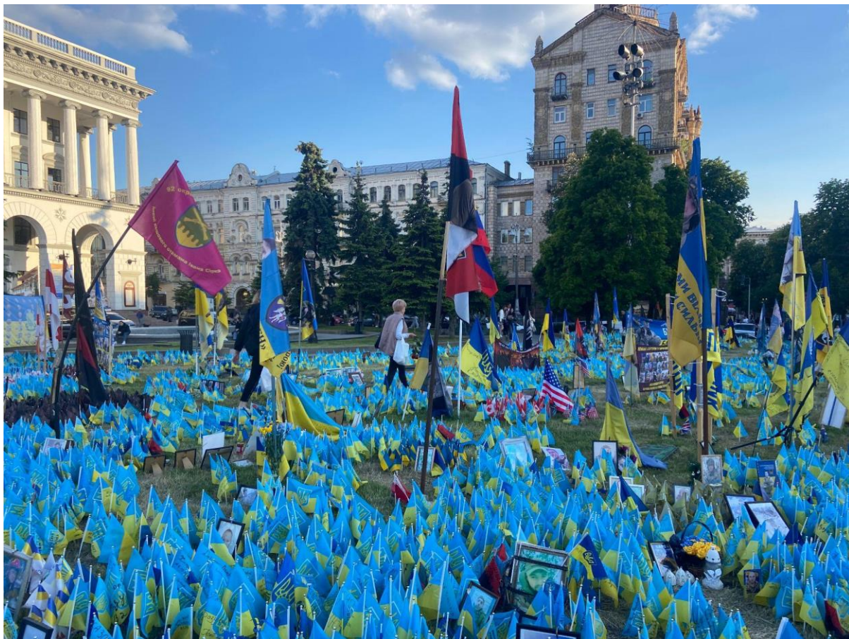
Рис. 3.4. Жінка з квітами прямує стихійним меморіалом на Майдані.

Проте громадські меморіали все ж не тотожні кладовищам, оскільки перші не просто відкриті для відвідування, а навіть активно запрошують незнайомців, поєднуючи в собі простір для скорботи й особистих роздумів з одного боку та потенціал до громадської активності та діалогу – з іншого. Цей другий бік виявляється ключовим, оскільки закликає не лише пам'ятати жертв, а й має шанс стати частиною ширшої дискусії, яка допомагає громадянам примиритися з минулим і зрозуміти його зв'язок із сьогоденням і майбутнім (Brett, Bickford, Ševčenko, & Rios, p. 6). Поява стихійного меморіалу сигналізує про ретельно продуману інвестицію в публічну демонстрацію пам'яті про загиблих, яка залучає інших – знайомих і незнайомих людей. Здебільшого характер таких меморіалів свідчить про те, що людина була пов'язана з цим місцем, і пам'ятають її як частину цього місця. Чимало меморіалів імпліцитно виражають бажання надати затишку і краси місцю (Kellaher & Worpole, 2010, p. 164).