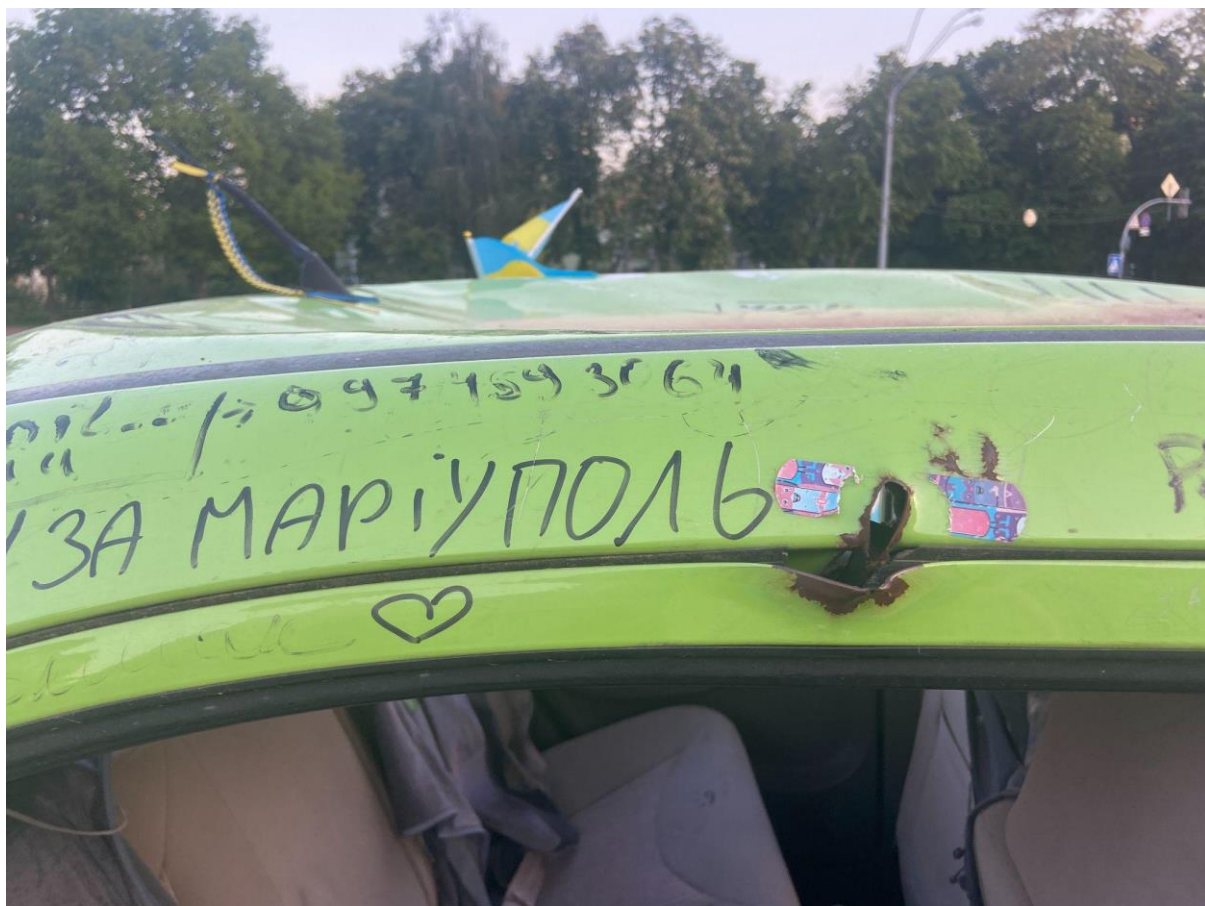
Рис. 3.10. Написи на розбитій російській машині на Михайлівській площі.