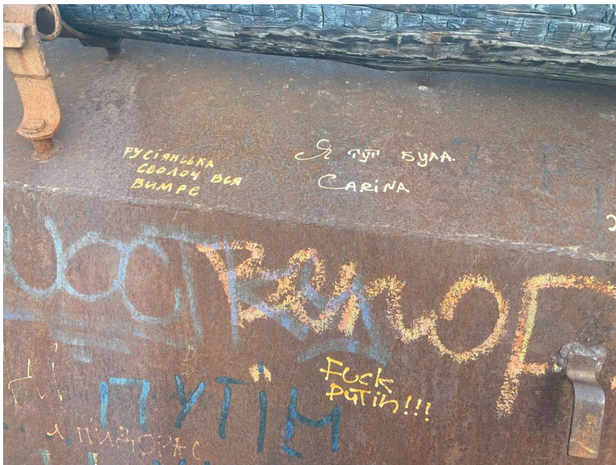
Рис. 3.11. Написи на розбитій російській техніці на Михайлівській площі.

Можна припустити, що ці три типи висловлень здебільшого характерні для різних категорій людей у просторі. Проте не маючи підстав робити якісь глибші судження, я можу просто виснувати те, що всіх людей, які беруть до рук маркер і ухвалюють для себе рішення втрутитися в цей простір, об'єднує відмінність від тих, кому навіть на думку не спадало, що можна повзаємодіяти з цими просторовими елементами. Ці послання ймовірно мають якийсь потенціал відображати ставлення як до простору, так і до воєнного контексту. Однак точно зрозуміло лише одне – у людей є інтенція втручатися в простір, взаємодіяти з ним, залишати свій відбиток. Поява техніки додала новий акцент Михайлівській площі, яка тепер затримує містян у своїх межах надовше.