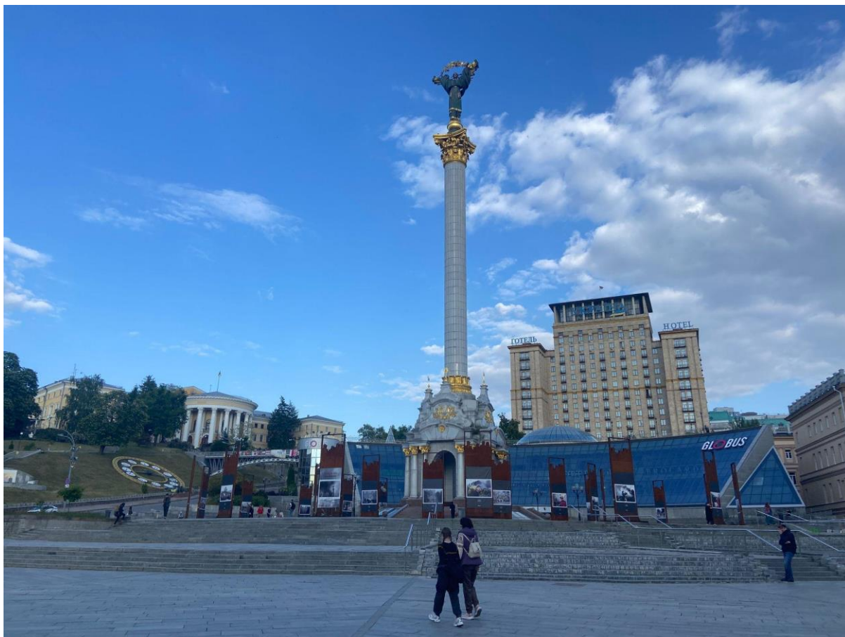
Рис. 3.6. Монумент Незалежності, оточений меморіальними стендами на Майдані.

зв'язку із нашаруванням нових символічних контекстів у просторі і збільшенні невідповідності між його семантичним навантаженням та дизайнуванням.