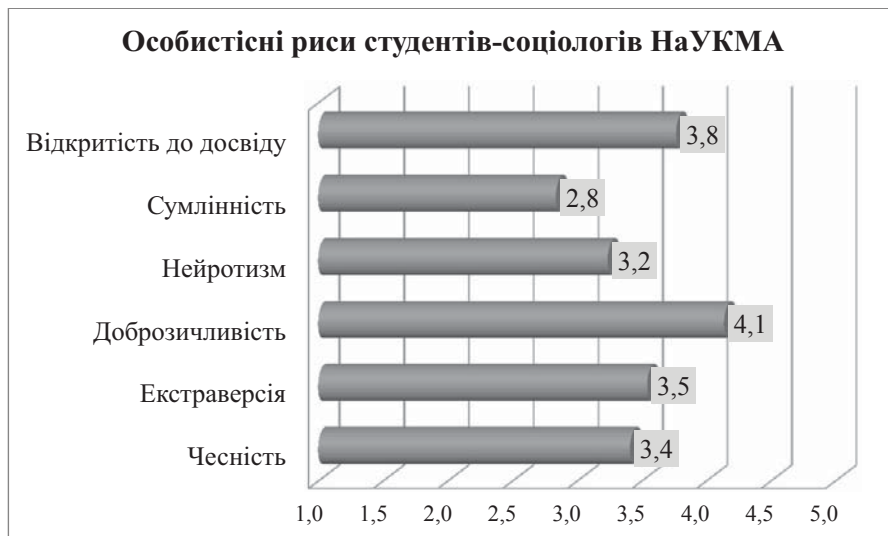
Рис. 1. Ступені прояву особистісних рис студентів-соціологів НаУКМА 1 року навчання

Результати опитування представлені на рисунку 1.