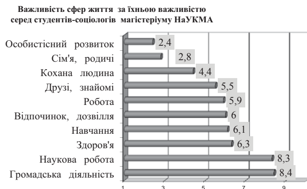
Рис. 3. Важливість сфер життя для студентів-соціологів НаУКМА 2 року навчання магістеріуму

Цікаво, що між середніми значеннями рангів цих сфер життя студентів бакалаврату різних років і студентів магістеріуму статистично значущих відмінностей виявлено не було. Однозначно спростувати висунуту гіпотезу наразі неможливо, через невелику вибірку студентів магістеріуму.