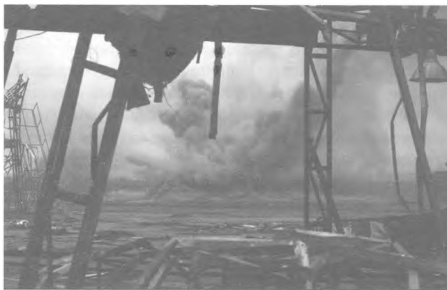
Кадр із фільму «Кіборги».