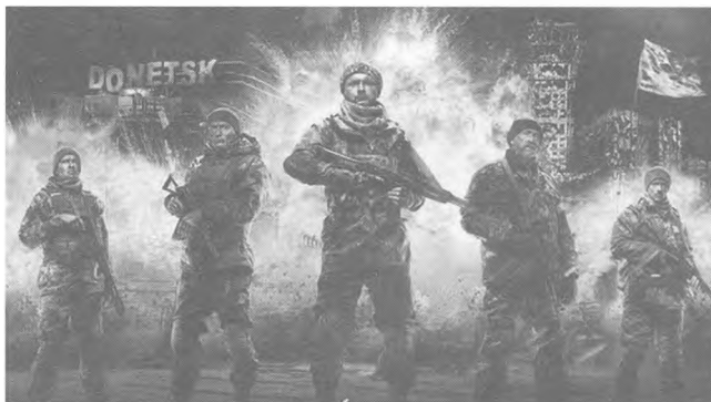
Плакат до фільму «Кіборги».