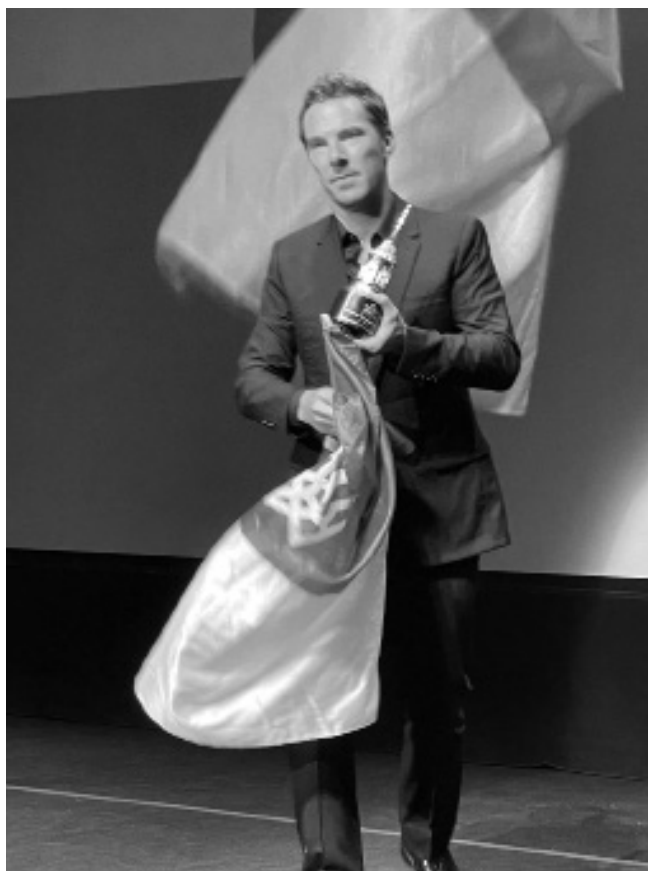
Британський актор театру і кіно Бенедикт Камбербетч на церемонії вручення йому премії «BAFTA» закликав підтримати Україну.

Останнім часом в Україні британського актора Бенедикта Камбербетча згадують у зв'язку не з новими фільмами, а з участю в британській урядовій програмі «Оселі для України», яка дозволяє британцям давати прихисток українським біженцям. Якраз на церемонії вручення премії «BAFTA», на яку номінувався за головну роль у «Владі