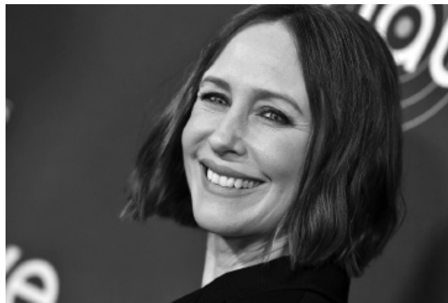
Американська кіноакторка українського походження Віра Фарміга.

Фарміга активно підтримує український народ у війні, яку російська федерація розв'язала на території України.