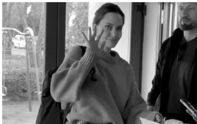
Американська кіноакторка Анжеліна Джолі під час перебування у Львові. Квітень, 2022.

пса», актор закликав дієво допомагати українцям, змушеним покинути дім через російське вторгнення: «Це на правду шокуючі часи – бути європейцем за дві з половиною години перельоту від України, і це щось, що нависає над нами. Ми всі повинні... робити більше, ніж носити бейдж [натяк на бейдж з українською символікою, який був на ньому – А. К.]. Ми повинні робити пожертви, ми повинні тиснути на наших політиків, щоб вони далі створювали свого роду притулок тут для людей, які страждають. Кожен мусить робити стільки, скільки може... зараз рекордне число людей, охочих прийняти в свої будинки, я сам сподіваюся бути частиною цього». Раніше на тому ж тижні на кінофестивалі в Санта-Барбарі Камбербетч вийшов з українським прапором і виголосив: «Єднаймося задля України» 1 .