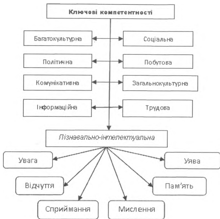
Рис. 2. Місце та структура пізнавально-інтелектуальної компетентності майбутнього фахівця

Компетентнісний підхід проголошено одним із напрямів стратегічного розвитку освіти в Україні. Саме його впровадження дає можливість зреалізувати очікування суспільства щодо поліпшення стану освіти, проголошені в національній Доктрині розвитку освіти. Ці очікування та надії спрямовані на перехід усієї системи освіти на нову парадигму освіти, на її конкурентність у європейському та світовому освітніх просторах. В цьому документі передбачено формування покоління молоді, яке буде мобільним на ринку праці, матиме необхідні якості для інтеграції в суспільство на різних рівнях, буде здатним навчатися протягом усього життя, здатним робити свідомо власний світоглядний вибір. Реалізація останнього можлива за умови організації такого навчально-виховного процесу, який би забезпечував кожному студенту можливість усвідомлення цінностей людської культури. Однією із провідних складових якої є загальна та професійна культура мислення