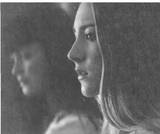
Сірша Ронан – Дейзі у фільмі «Віолет і Дейзі». Режисер Джеффі С. Флетчер. США, 2011.