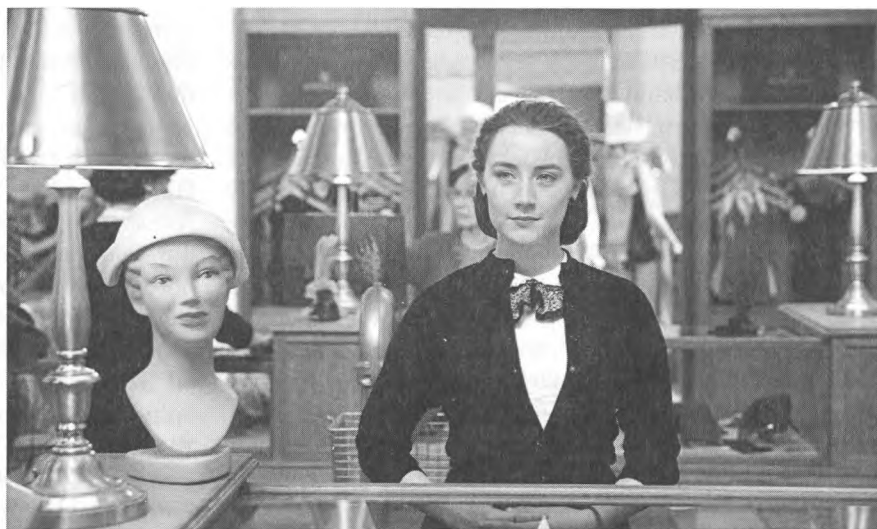
Сірша Ронан – Еліс Лейсі у фільмі «Бруклін». Режисер Джон Кроулі. Ірландія, Великобританія, Канада, 2015.

ють дівчину привабливим майбутнім тут, в Ірландії. Героїні Сірші доводиться вирішити серйозний внутрішній конфлікт: віддатися такому привабливому звичному плину і насолодитися уже здобутим чи будувати нове незвідане й невідоме життя в Америці по суті з нового чистого аркуша. Зважитись на серйозний крок і найважливіше рішення в житті Еліс допомагають місцеві мешканці.