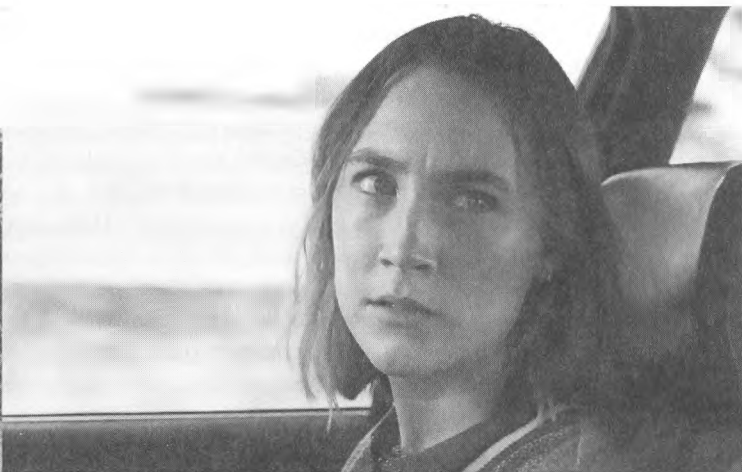
Сірша Ронан – Крістін Макферсон у фільмі «Леді Птаха».