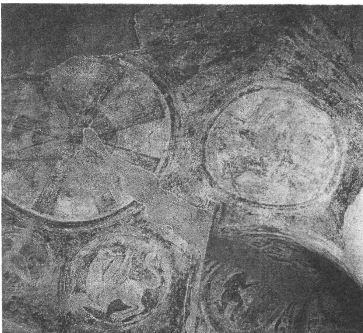
Мал. 1. Склепіння Північної башти.

Церква, за визначенням середньовічних авторів, є моделлю Всесвіту, "космосом космосу";