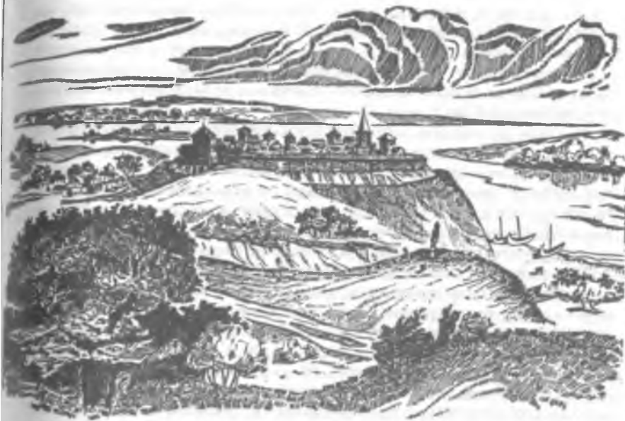
Мал. 2. Реконструкція Родня (за Г. Г. Мезенцовою).

заперся в городі Родні на усті Росі. А Володимир увійшов у Київ. І обложили [вої Володимирові] Ярополка в Родні, і був голод великий у ньому, і єсть примовка й до сьогодні: "Біда, як у Родні" 6 .