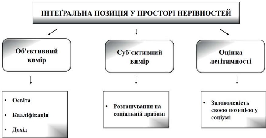
Рис. 2.1.2. Вимірювання інтегральної позиції у соціальному просторі

Третя група ознак була спрямована на з'ясування узагальненої позиції індивіда у системі економічної нерівності . Узгодженість її об'єктивного та суб'єктивного вимірів, а також оцінки легітимності наявної системи розподілу благ вимірювалась за кількістю вищих, середніх і нижчих позицій за шкалами відповідних ознак. Класифікація індивідів за узагальненою позицією у системі економічної нерівності повторювала порядок дій, викладений вище для типології об'єктивних позицій у соціальному просторі. Структурні елементи також були аналогічними.